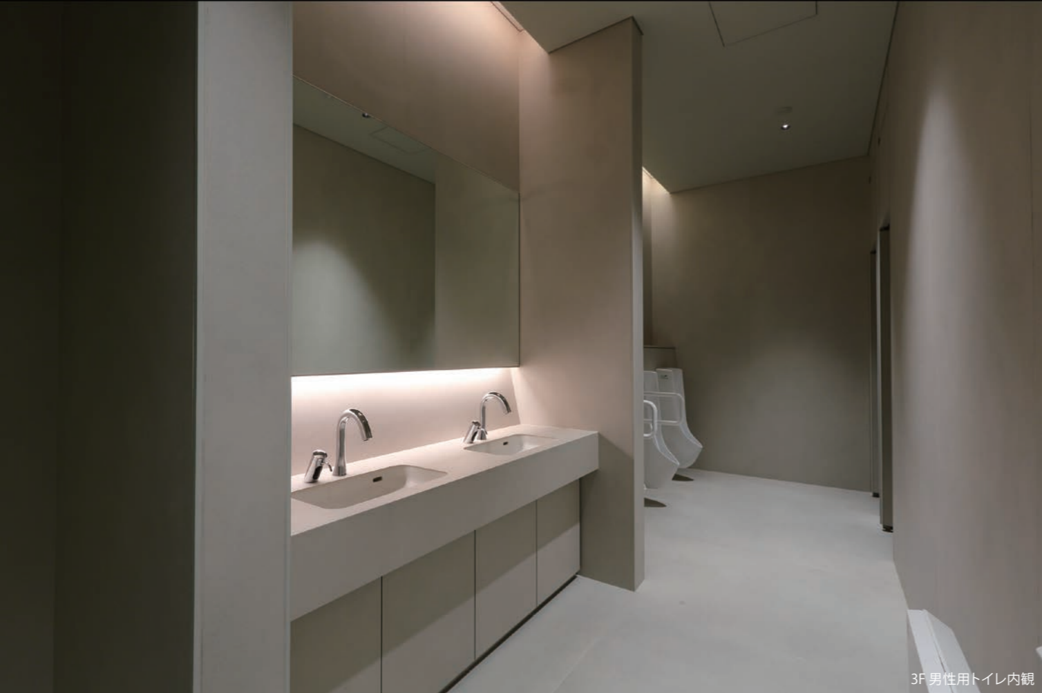
3F 男性用トイレ内観