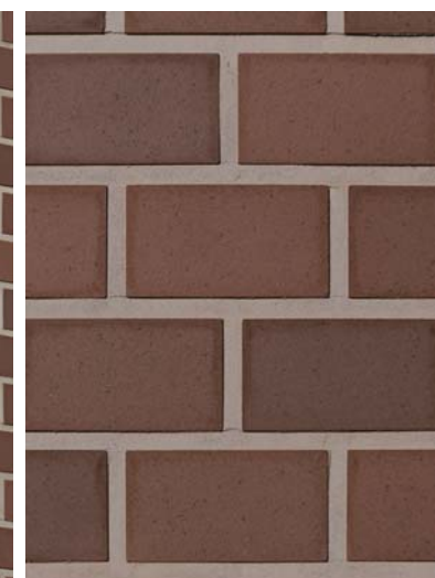
外装壁タイルディテール