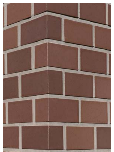
外装壁出隅部タイルディテール