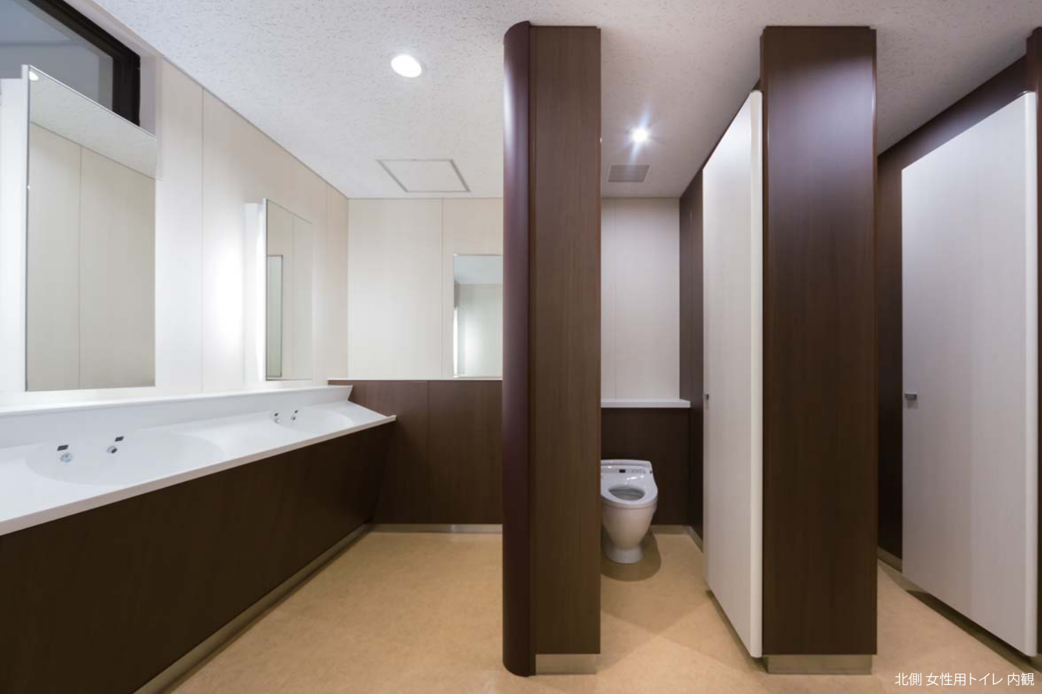
北側 女性用トイレ 内観