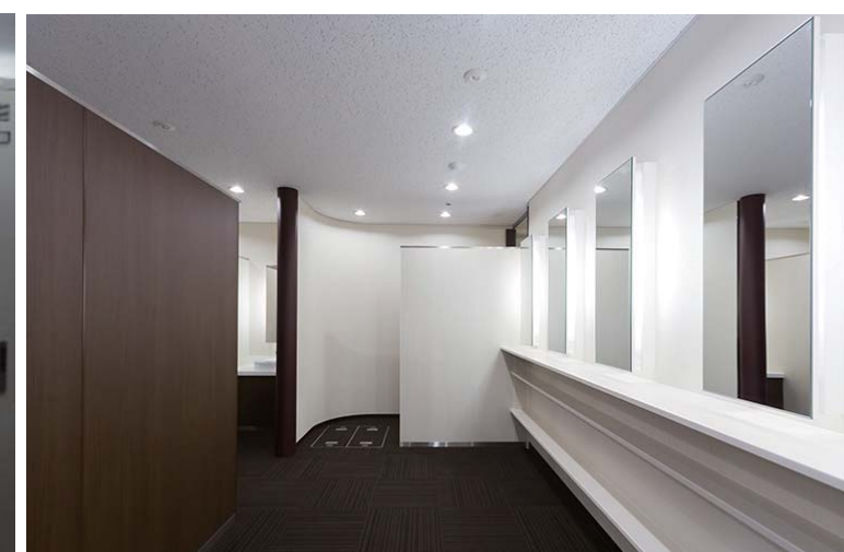
入り口脇は、緩やかな曲面の間仕切り壁でパウダーコーナーや着替えブースへの視線をカット。