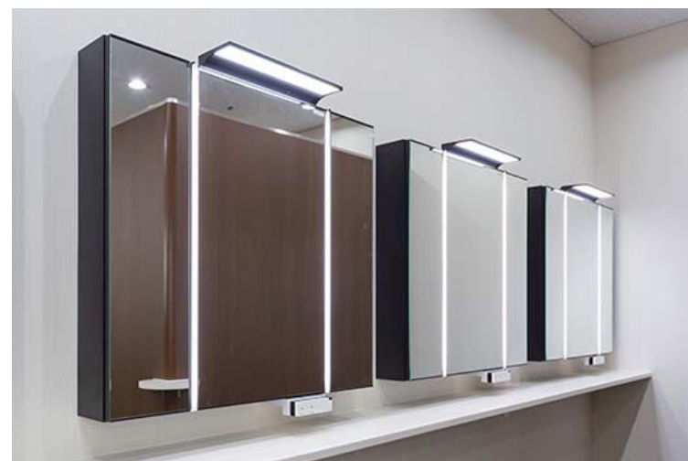
明るさ調整可能な上部LED照明+縦型LED照明付。ミラー下まで伸びた縦型照明は、左右からの光で身長が低い人でも顔に影が出にくく使いやすい。