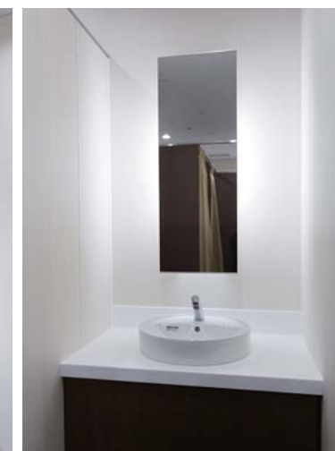
洗面コーナーを設置し、メイク等で汚れた手洗いや歯磨きもパウダールーム内で可能に。向かいにはカーテンで仕切られる着替えブースを完備。