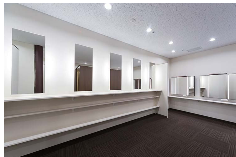
パウダーカウンターはバック照明付のシンプルな一面鏡と三面鏡を配置。カウンターの2段目・3段目は背板との入隅部分に隙間を設けることでホコリだまりを防ぎ、奥に向かってわずかに傾斜をかけることで荷物が落ちにくくなるよう配慮。全体的にカウンター奥行きを短くしたことで顔を近づけやすく、使い勝手の良いパウダー空間へ。