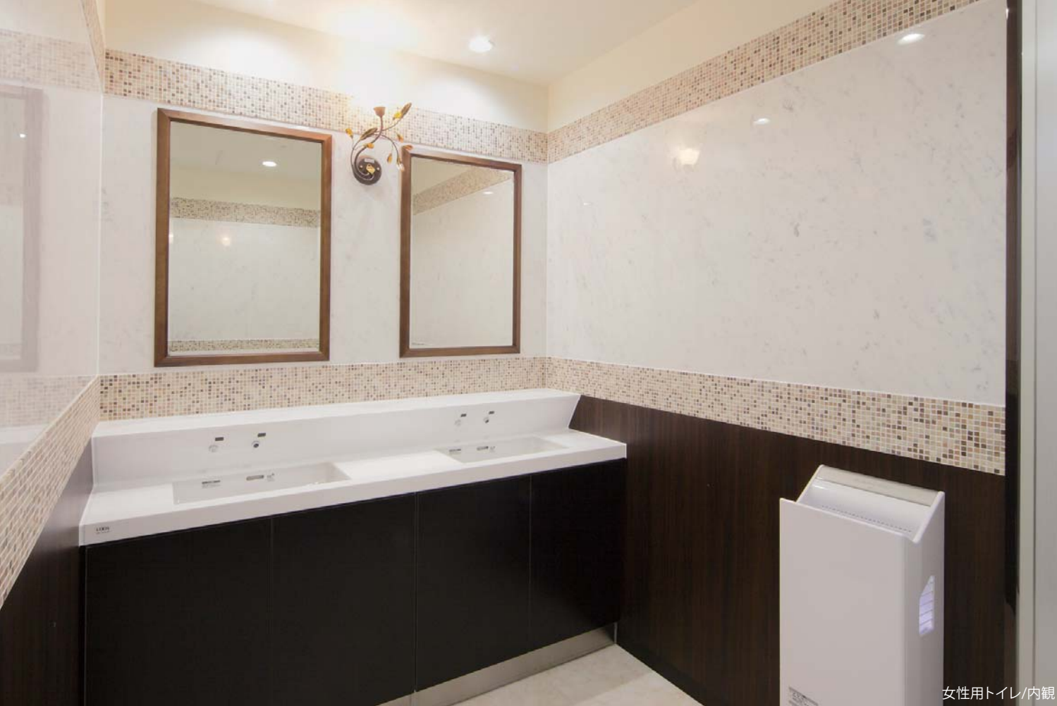
女性用トイレ/内観