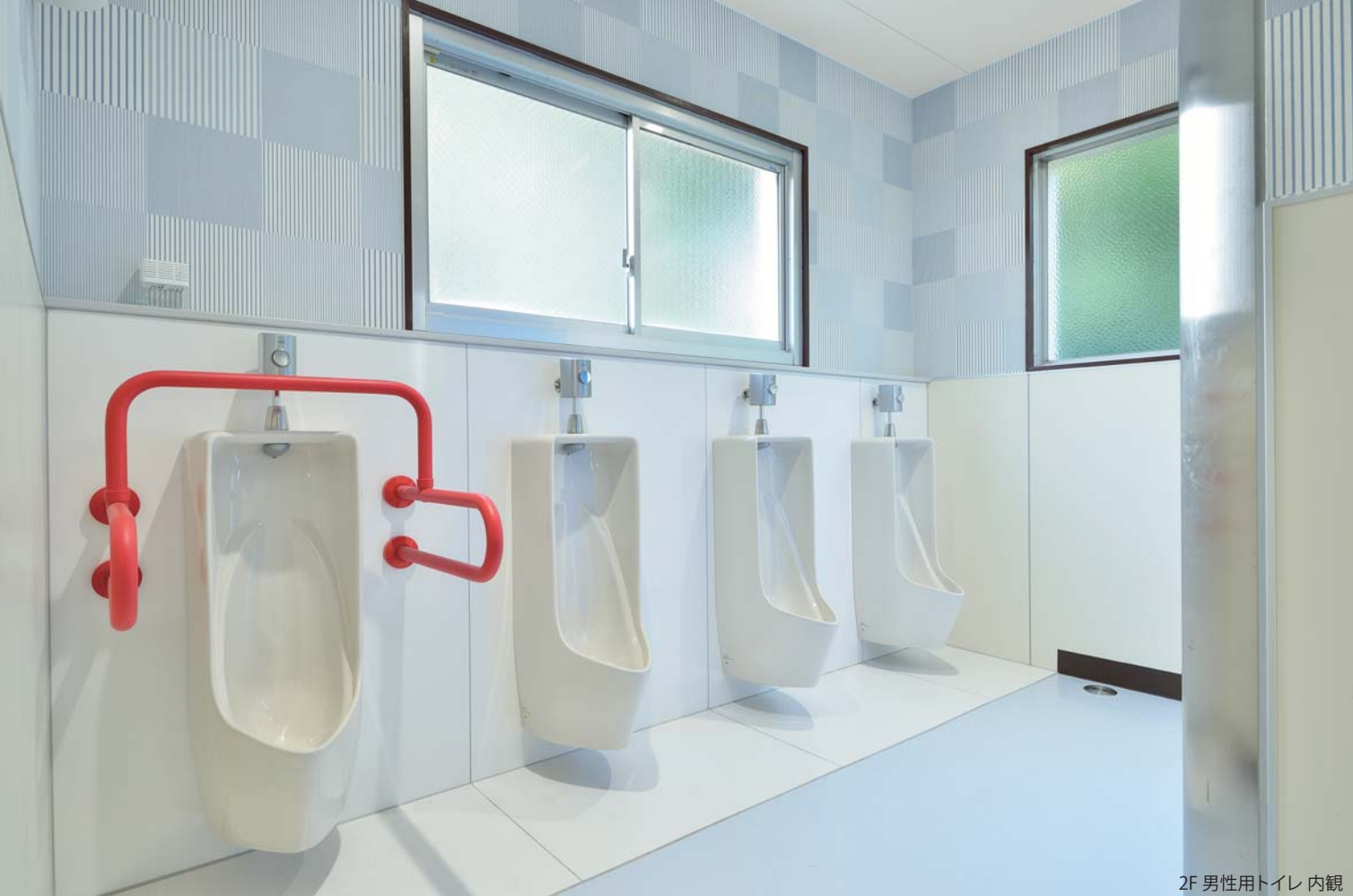
2F 男性用トイレ 内観