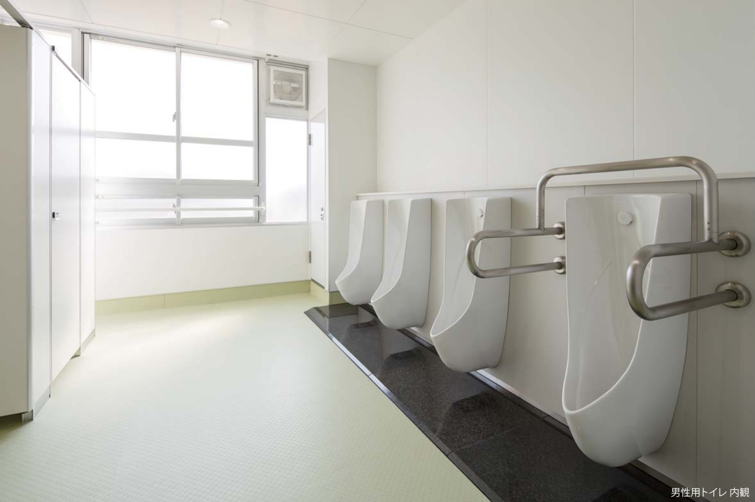
男性用トイレ 内観