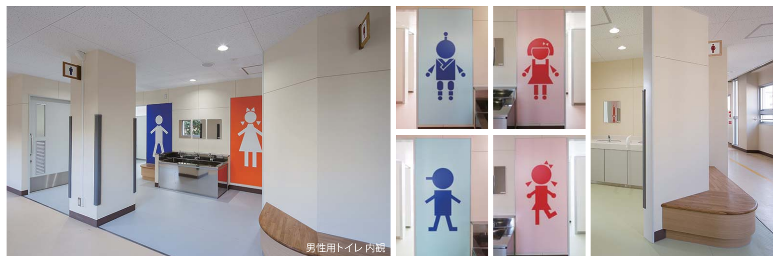
男性用トイレ 内観

大きなトイレサインが特徴的な入り口まわり。サインは子ども達がデザインしたもので、1~3Fがそれぞれ異なる絵柄になっている。友達を待つ間にも便利な談話コーナーとしてベンチも備え、子ども達が親しみやすいスペースになっている。