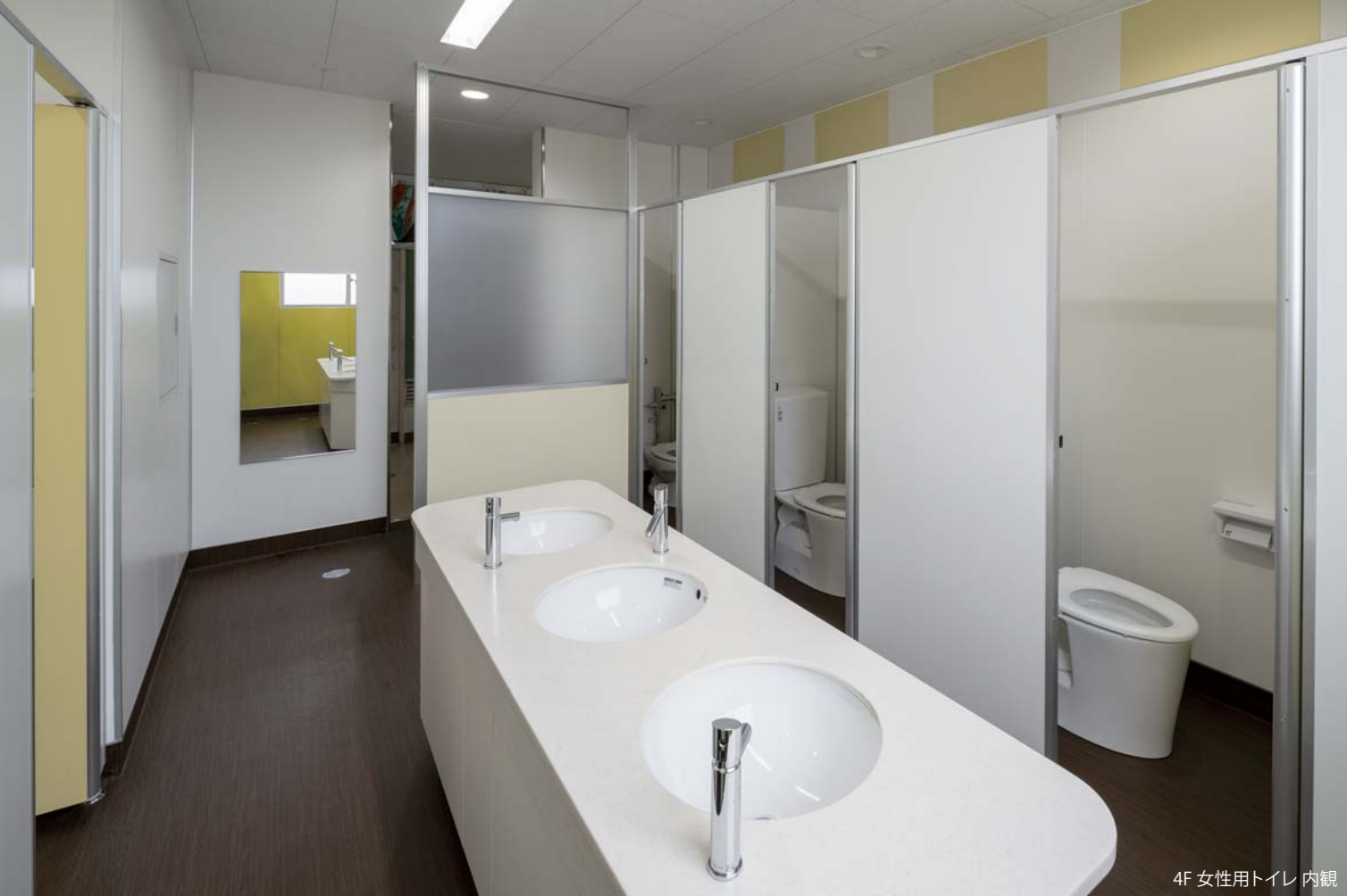
4F 女性用トイレ 内観