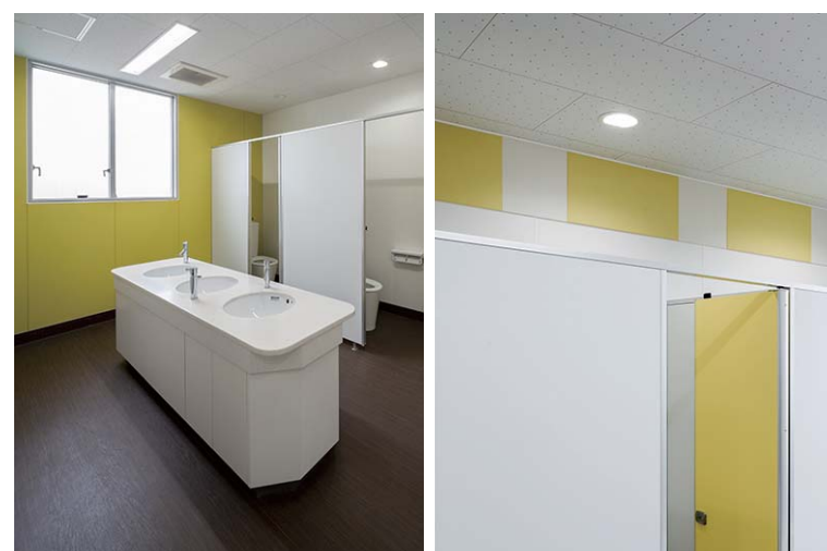
交流の場となるようアイランド型の手洗いカウンターを採用。児童が興味を持って触りやすいエコカラットは、手が届かない 位置に設置している。各階男女のトイレに1ブースずつ、低学年用に低リップ便器を採用。