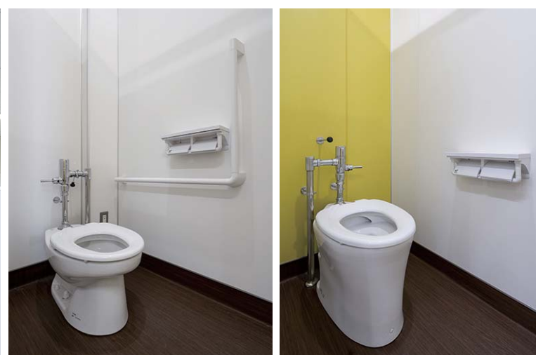
1~3Fはフラッシュバルブ式を採用。便器 は全て掃除口付としている。