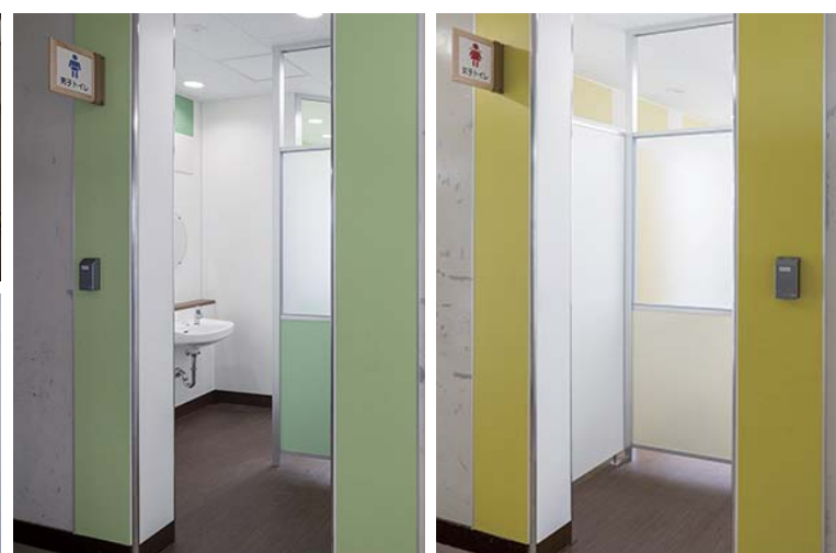
衛生面を考慮してドアレス・半透明のパネルで目隠しを設置。性別やジェン ダーによる固定観念にとらわれず、男子/グリーン・女子/イエローの配色を採用。