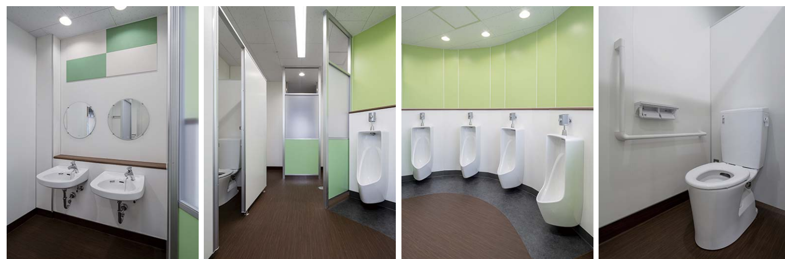
小便器をラウンド状に配置することで、限られたスペースに便器数をより多く確保し、間仕切りなしでも隣の児童の視線が気にならないよう配慮。ラウンド状の配置と円形 の鏡がトイレ空間を楽しい雰囲気。上部のカラフルなエコカラットは空間演出とニオイ軽減に貢献している。最上階の4Fは水圧が弱いため男女共にタンク式を採用した。