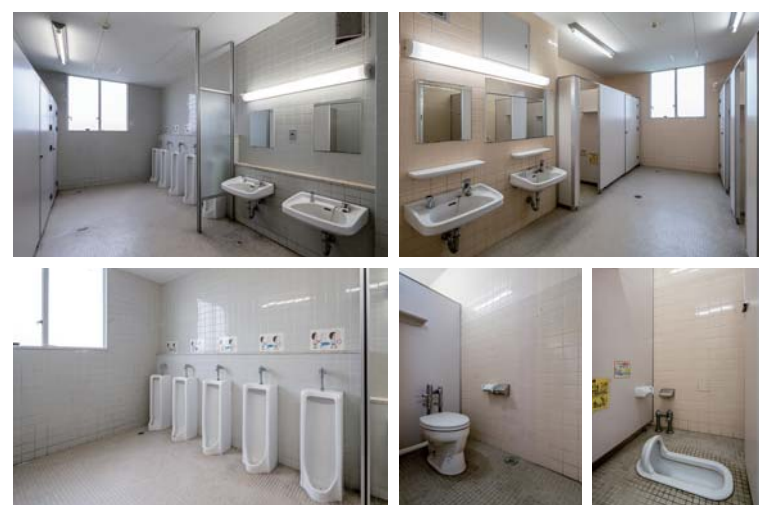
(上) 男性用トイレ内観 (下) 小便器