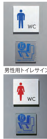
男性用トイレサイン