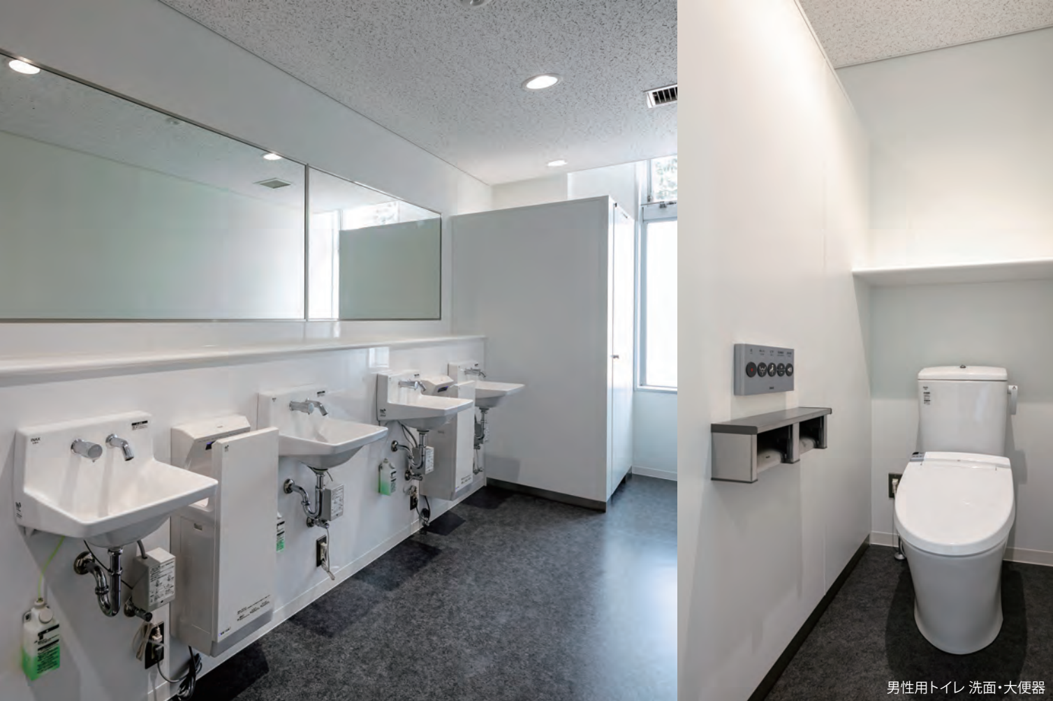
男性用トイレ 洗面・大便器