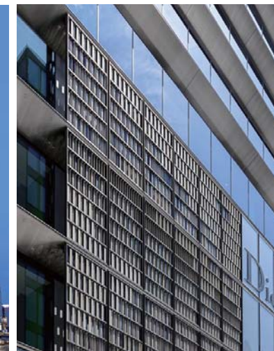
北西側中層部外装壁面