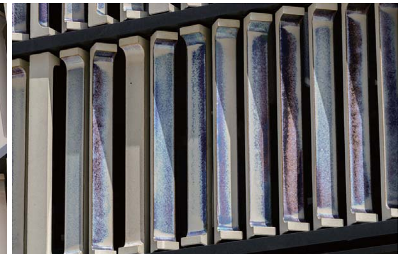
外装壁面テラコッタディテール