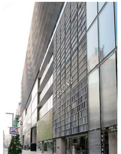
南西側中低層部外装壁面