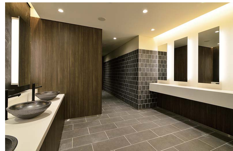
焼き物の手洗器がこだわりの空間をさらに個性的な和の空間として演出。洗面エリアの機器の白が映える落ち着いた雰囲気のトイレ。センサー式の小便器は流し忘れても対面に設けたパウダーコーナーは、鏡裏の照明が空間全体に奥行き感をもたらしている。自動的に洗浄し衛生的。ブース間仕切りは天井まで伸ばし、落ち着いて使用できる。