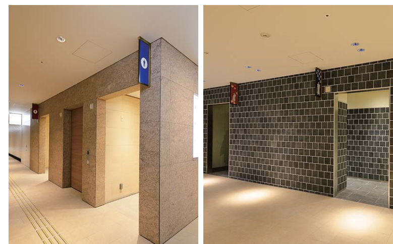
トイレ1入り口 間口を広く取ったトイレ入り口は、通路に面しアクセスしやすい。トイレ2はなまこ壁をイメージしたタイル張りや黒漆喰の壁面で、名古屋の町屋を感じさせるデザイン。