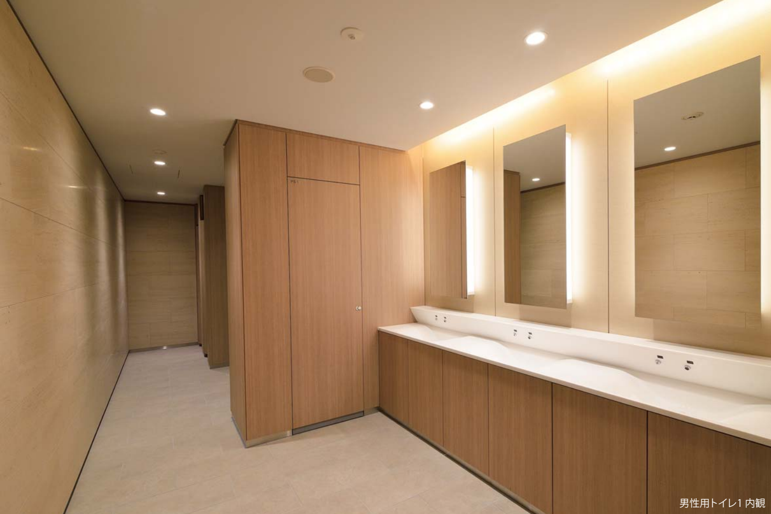
男性用トイレ1内観