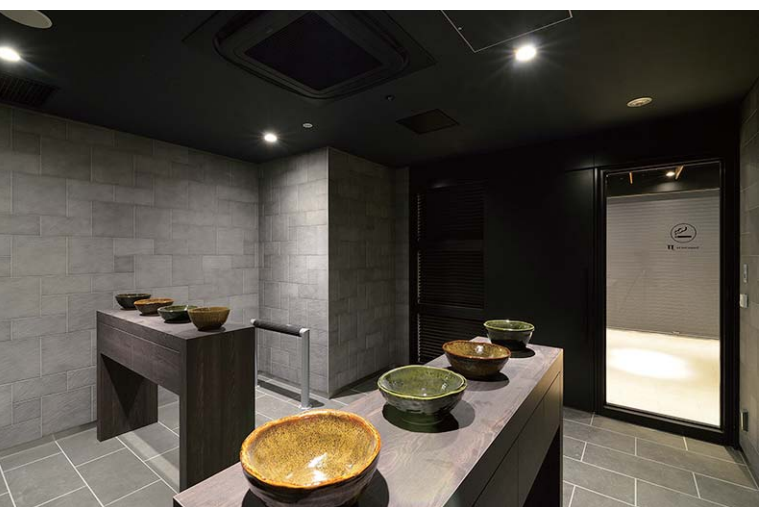
タイル張りの壁と床が重厚な雰囲気を出す喫煙室。色味や形がそれぞれ異なる焼き物が灰皿になっており、黄色と緑が空間に映え、アクセントにもなっている。