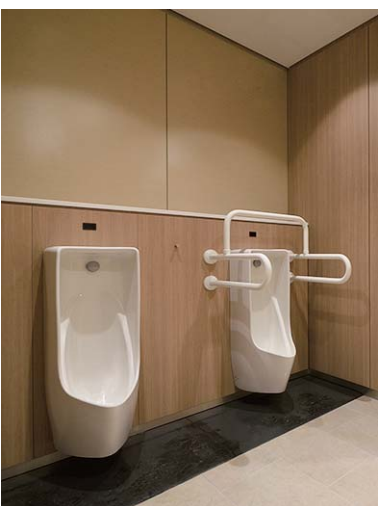
小便器エリアにはフックを設置するなど、手荷物の置き場所にも配慮。