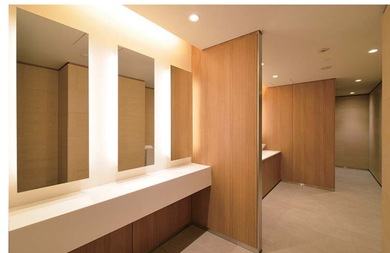
明るい木目を基調とした室内。鏡裏と天井からの間接照明が空間のアクセントとなりやわらかい雰囲気を演出している。ドライエリアを確保したノセルカウンターを採用。大便器は清掃性に優れた壁掛式を採用し、L型手すり付きのブースも設置。