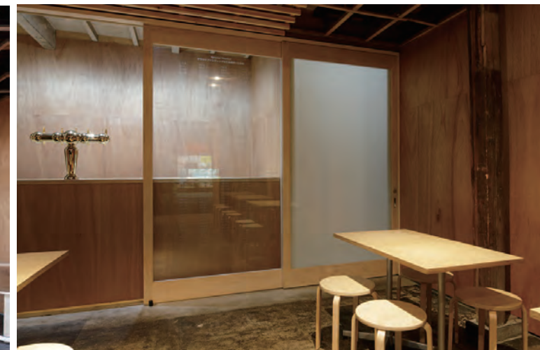
1F左手ビールサーバーカウンターと右手トイレ入口(夜間)