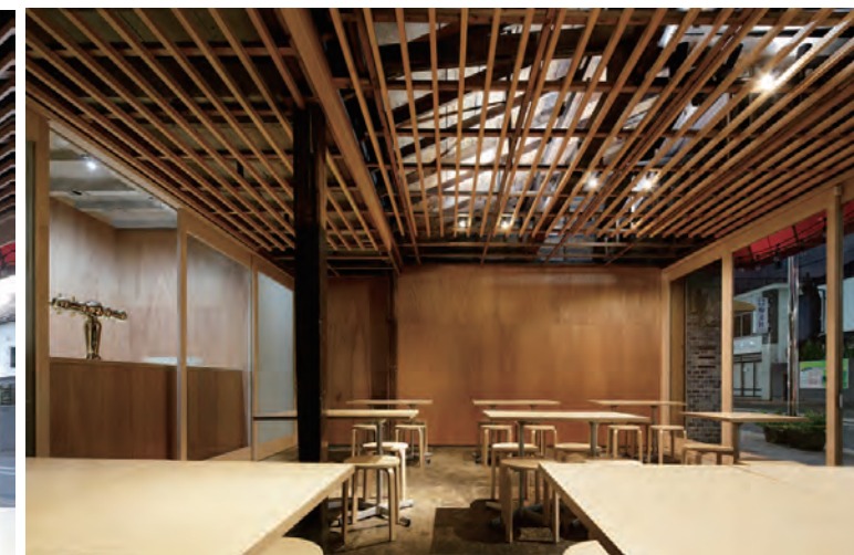
1F東側より内観(夜間)