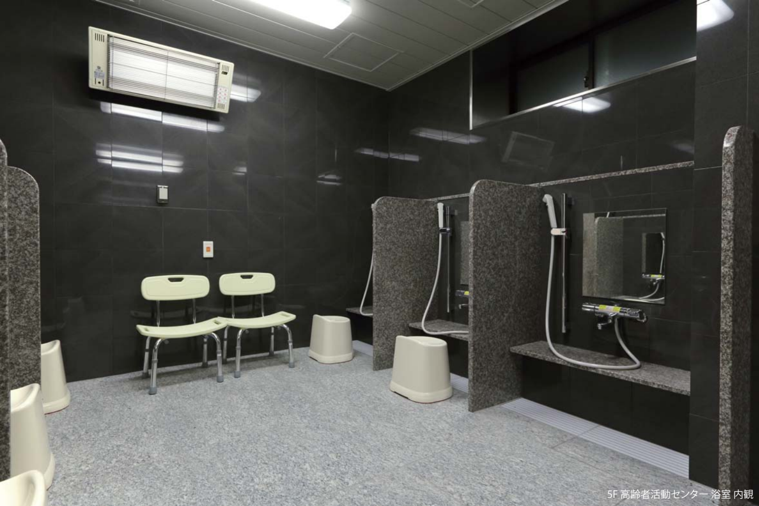
5F 高齢者活動センター 浴室 内観