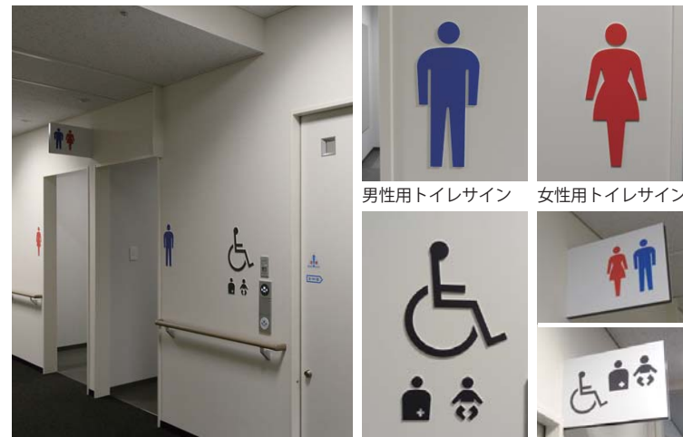
男性用トイレサイン 女性用トイレサイン