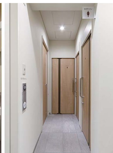
文京区立 本郷会館

限られたスペースを有効に使ったトイレエリア。一般トイレの入り口には折り戸を採用している。個室タイプの女性用トイレにはコンパクトな壁付手洗器を設置することで、動作空間を確保し空間を広く使うことができる。