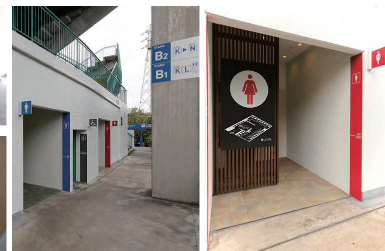
ライン状に色分けされたトイレ入り口。混雑が予想される女性用トイレは入り口に地図を設置し、奥のブースまで使えるよう室内のレイアウトを案内している。