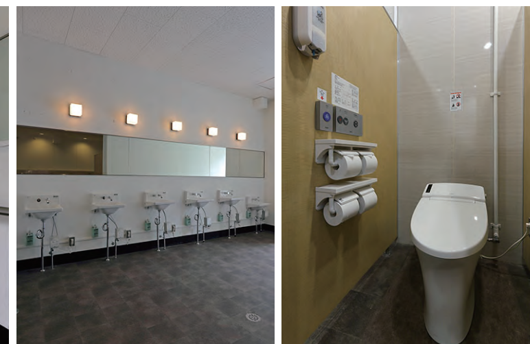
洗面器には非接触で衛生的な自動水栓を採用。レース開催中など混雑時はペーパー補充が困難になるため、2連の紙巻器を2つ設置している。