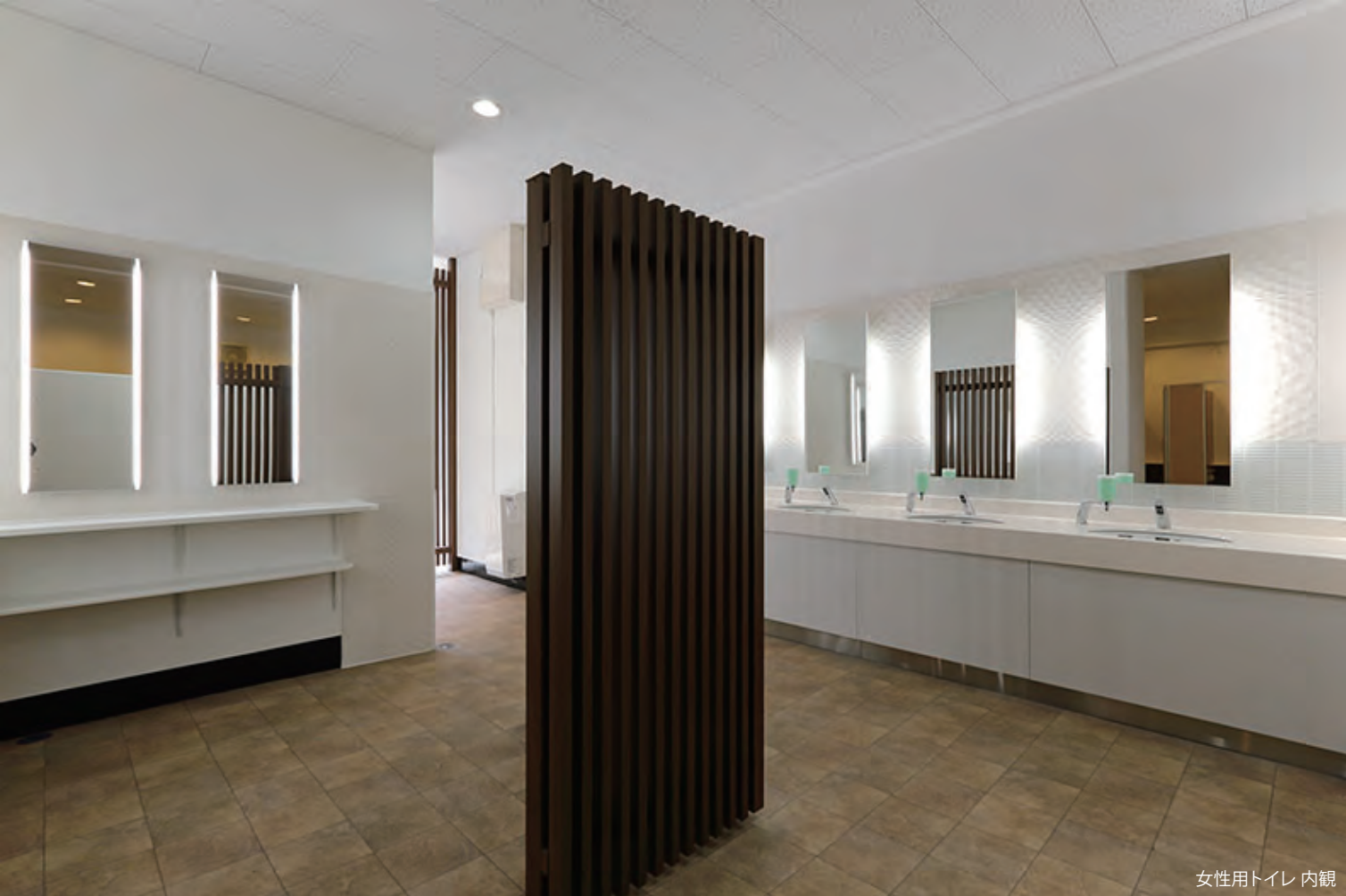
女性用トイレ 内観