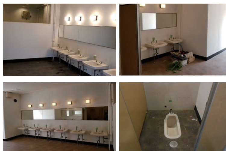
(上) 男性用トイレ 洗面エリア (下) 女性用トイレ 洗面エリア