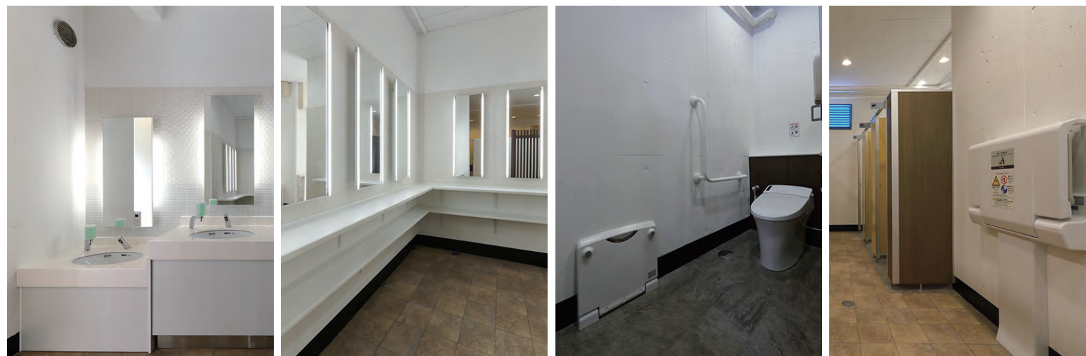
洗面カウンターは子ども用高さも設置。パウダーコーナーには棚を2段設けることで手元にスペースを作ることができ、鏡もフロント照明付きなので快適に化粧直しができるようになっている。着替えやおむつ替えにも便利なチェンジングボードを備えた広めブースの他、ブース外にもおむつ交換台も備え、子ども連れに配慮してる。