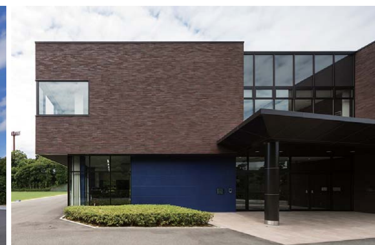
エントランス正面側外装壁面