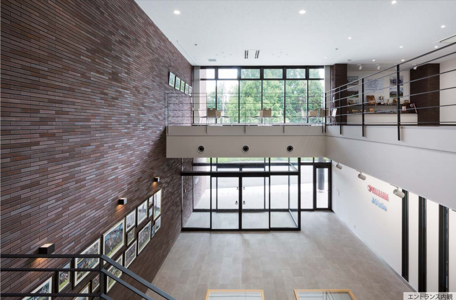
エントランス内観