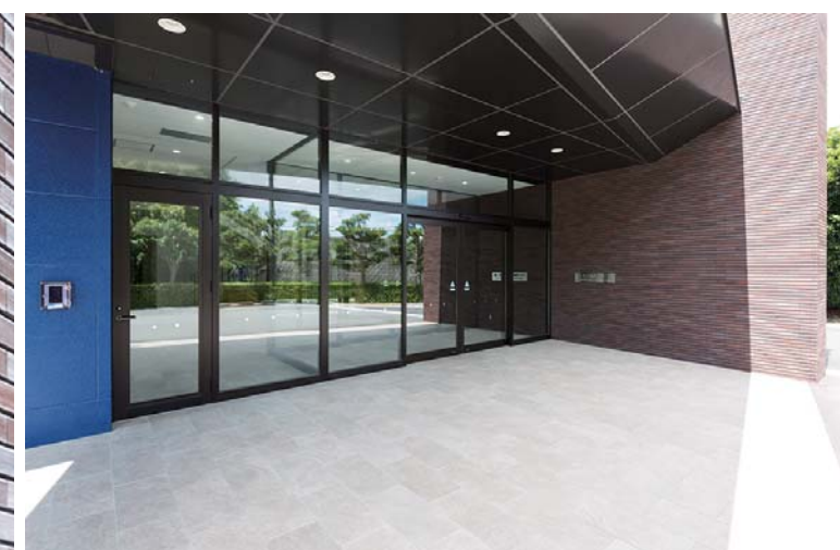
エントランス外装壁床面