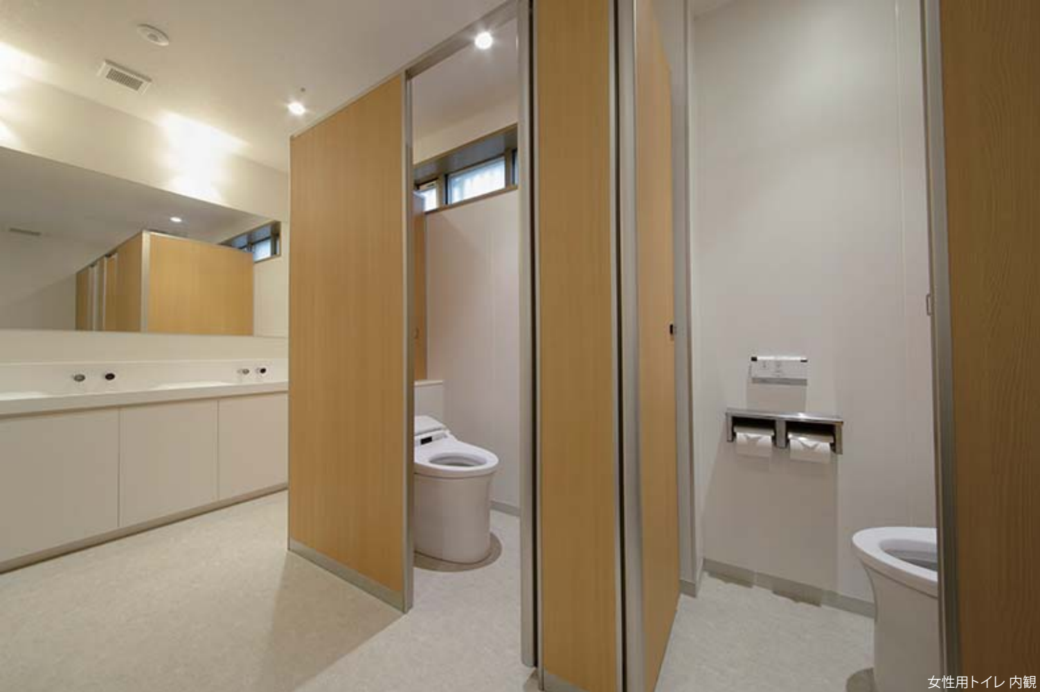
女性用トイレ 内観