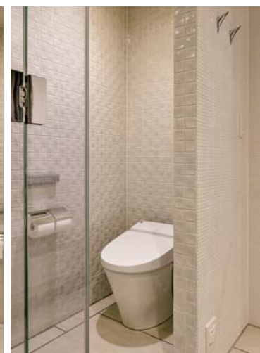
トイレ(シャワールーム側)