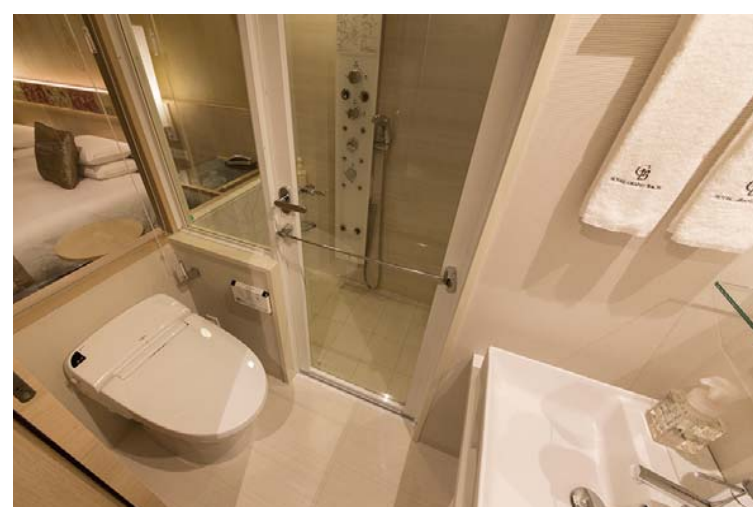
洗面、トイレ&シャワールーム