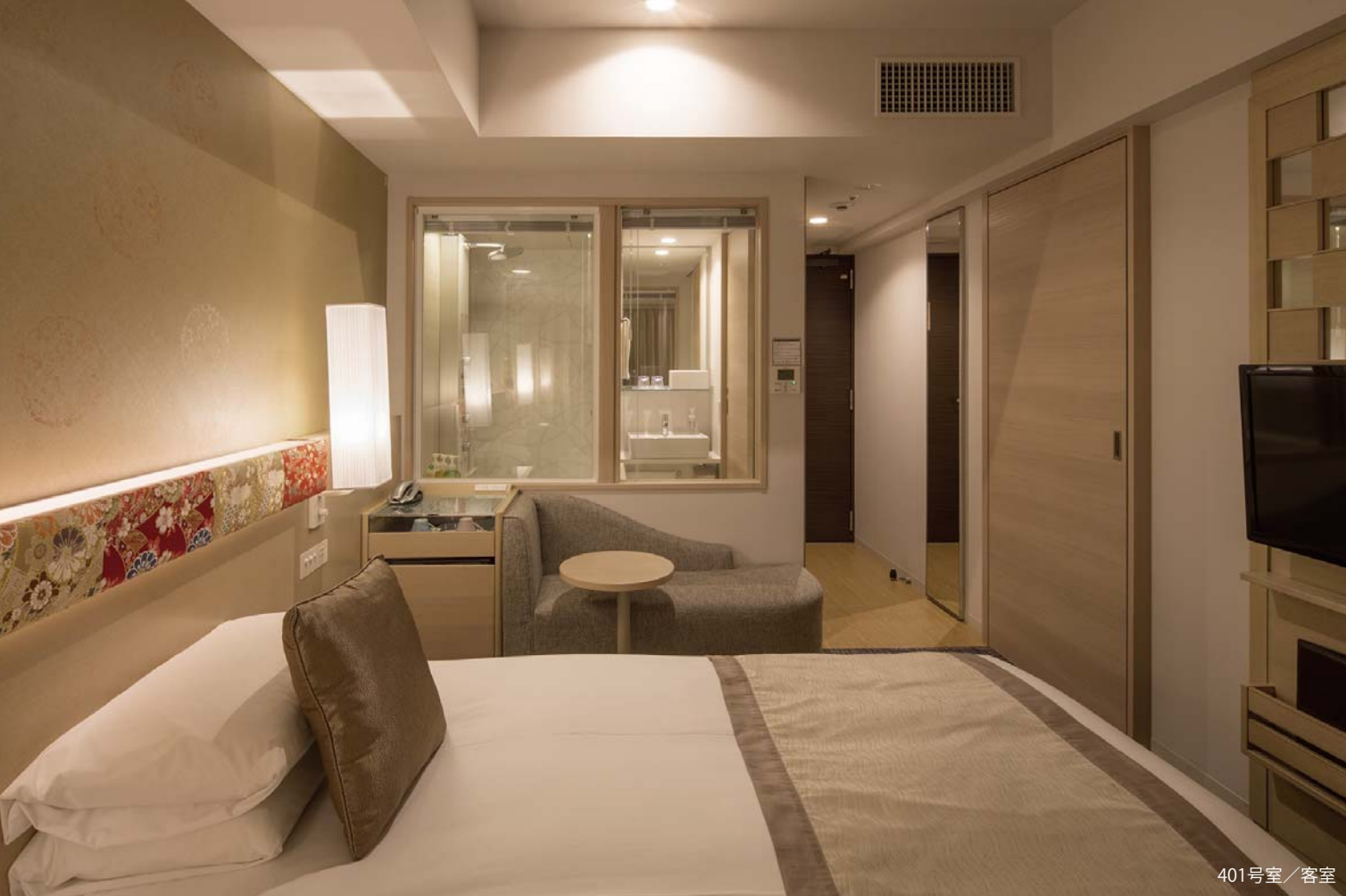
401号室 / 客室