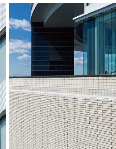
擁壁タイルディテール