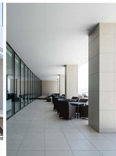
西ウイング棟外壁・外床