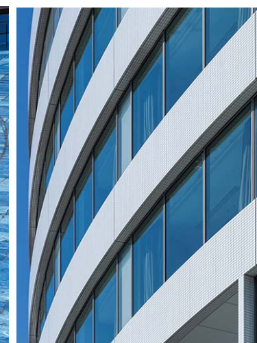
外装タイルディテール