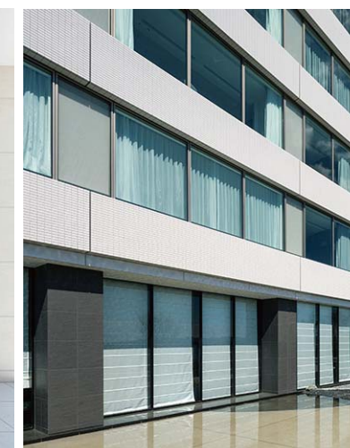
東ウイング棟外壁・外床