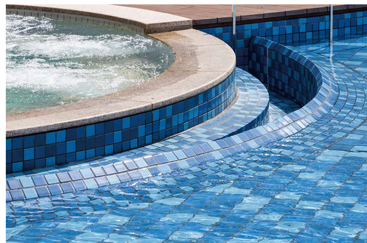
プールモザイクタイルディテール