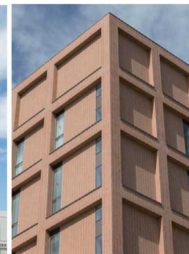
コーナー部外装壁面