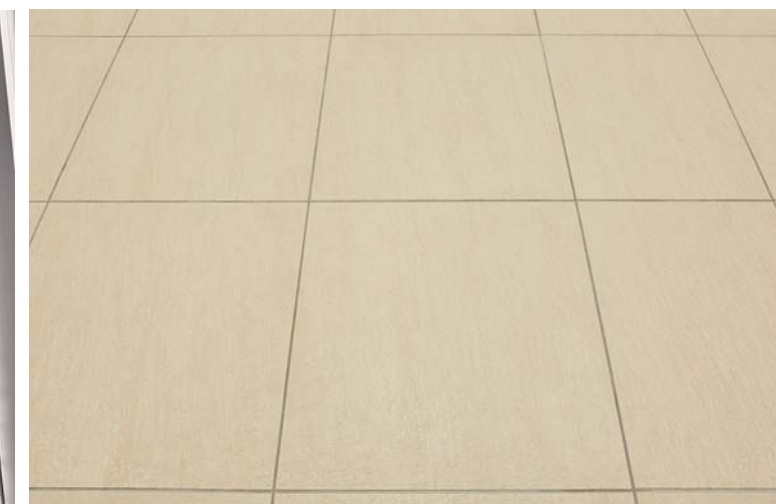
内装床面タイルディテール