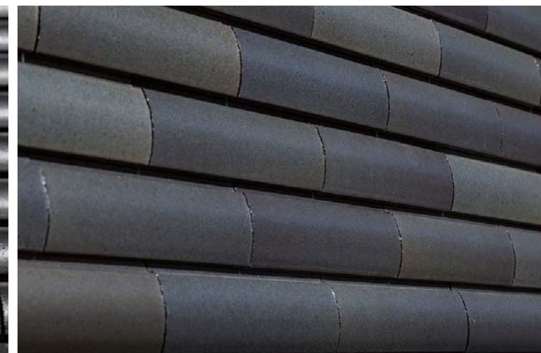
外装壁面タイルディテール