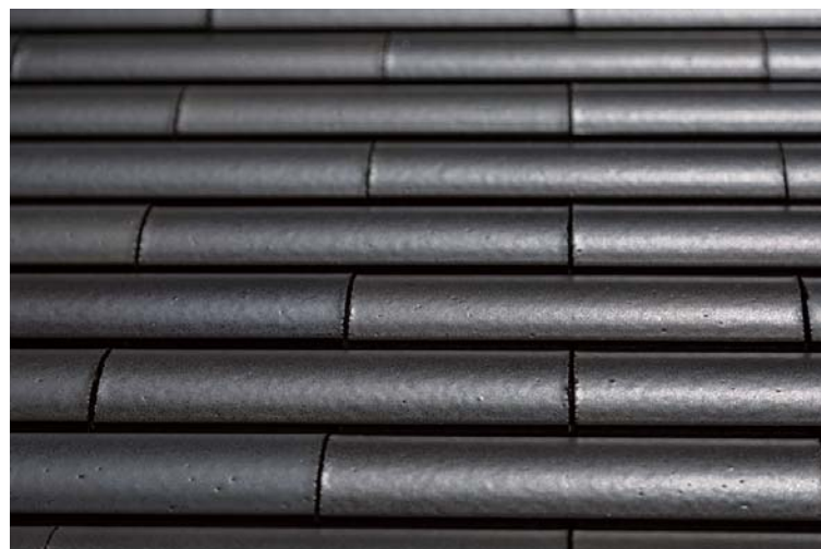
外装壁面タイルディテール