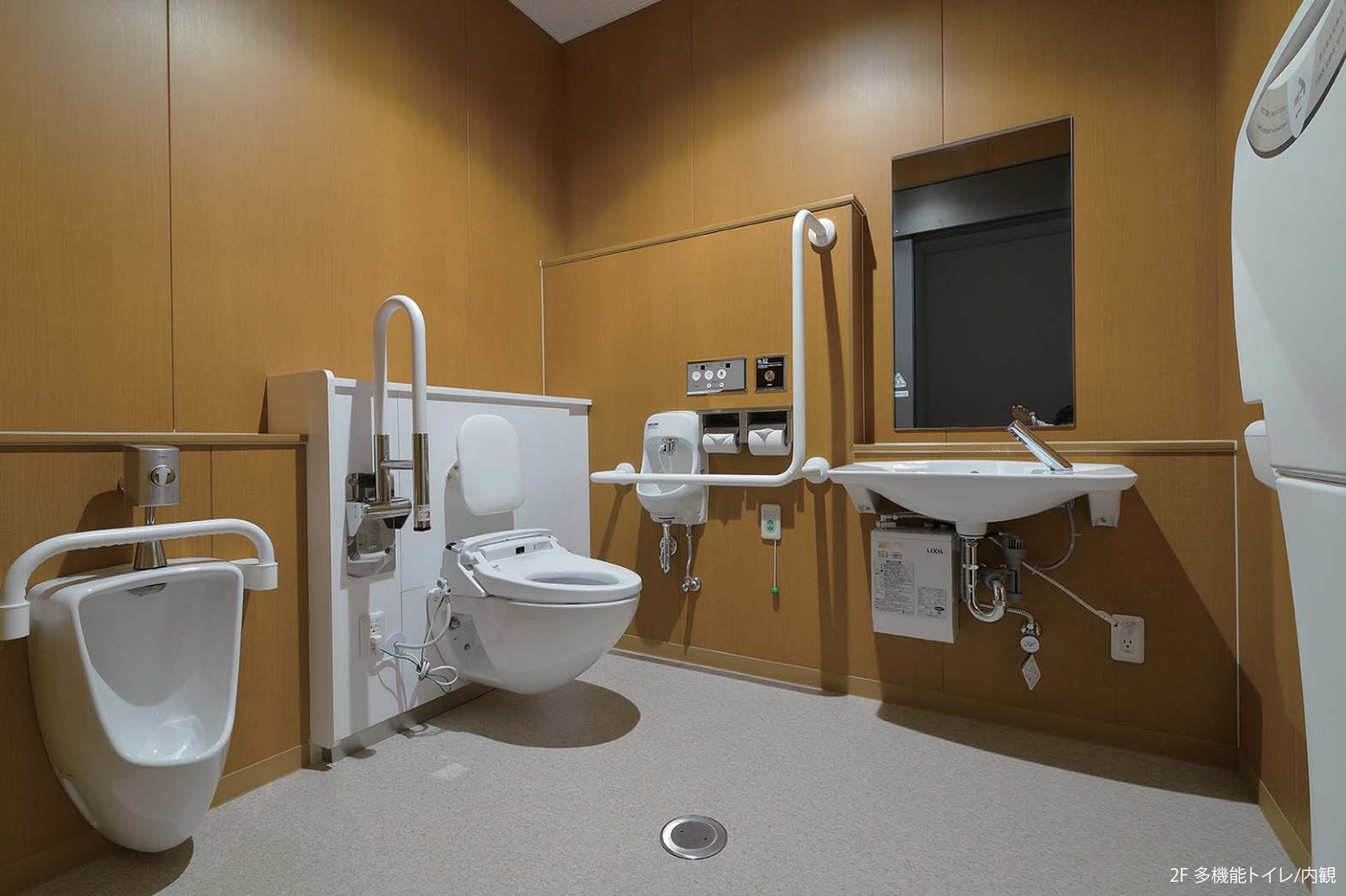
2F 多機能トイレ/内観