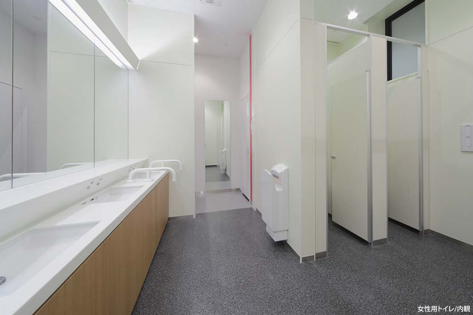
女性用トイレ/内観