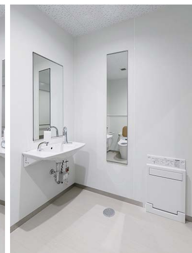
車椅子可動域や介助者の動きを考慮し、十分なスペースを確保した多機能トイレ。着替えに便利なチェンジングボードも備えている。