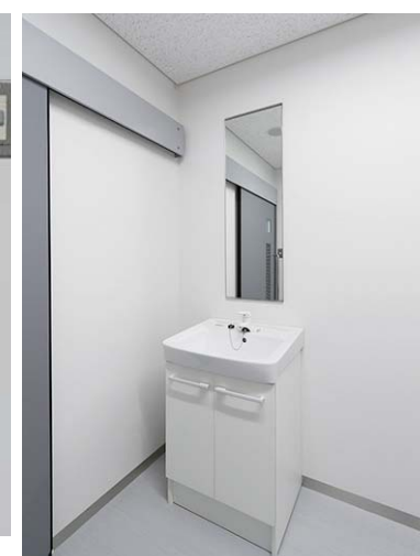
授乳室には洗面化粧台を設置。