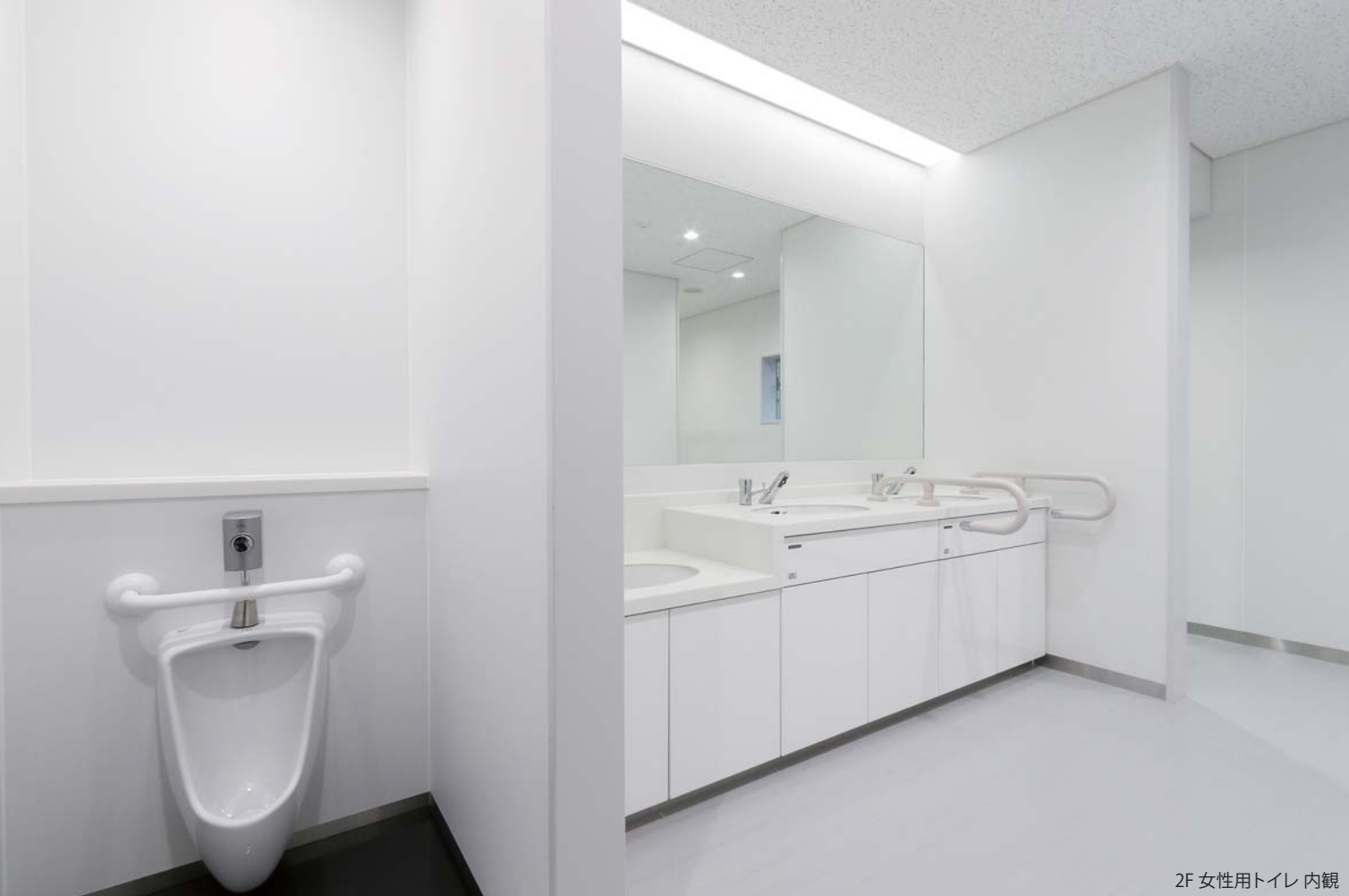
2F 女性用トイレ 内観