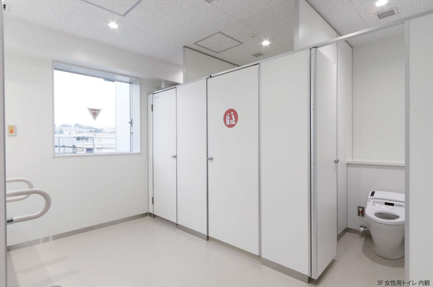
3F 女性用トイレ 内観