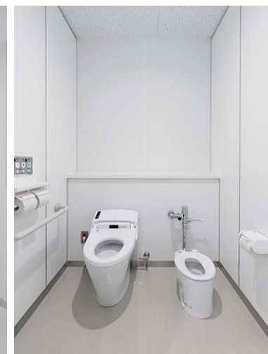
洗面カウンターには自動水栓を採用し、利用者の快適性と衛生面に配慮。幼児用便器を並べた親子トイレやおむつ替えコーナーも設けている。