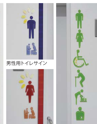
男性用トイレサイン