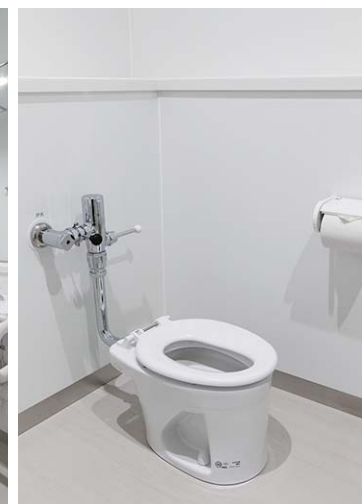
ゆったりとした個室タイプの男性用トイレ。幼児用便器や幼児用高さの手洗器を設け、子ども連れの利用者に配慮。