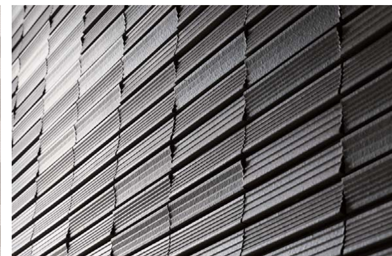
内装壁面タイルディテール