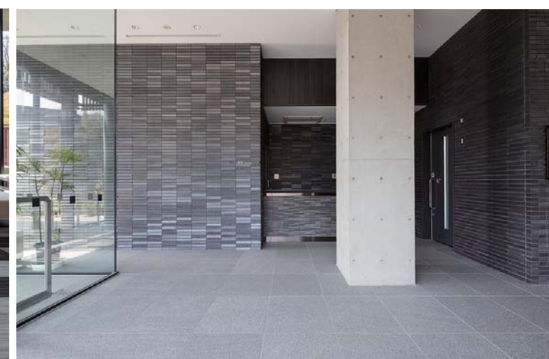
エントランス内装壁面