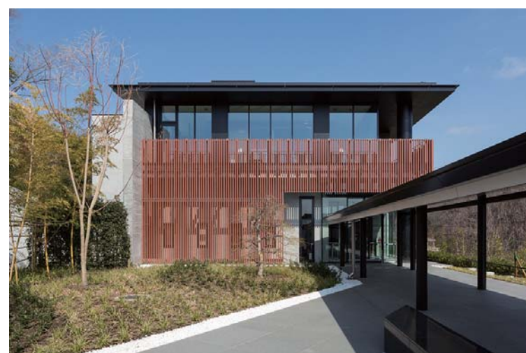
エントランス入口外装壁面