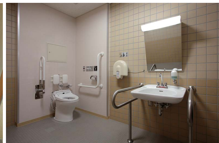
各種手すりやケアサポート水栓付背もたれも設置。