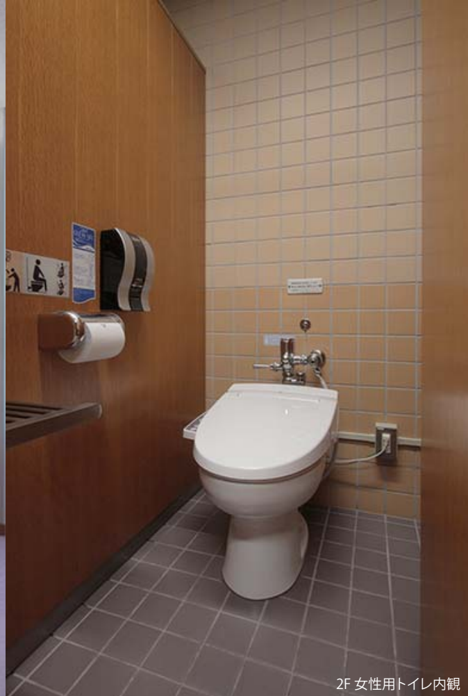
2F 女性用トイレ内観