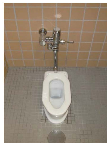
バリアフリー対応便器