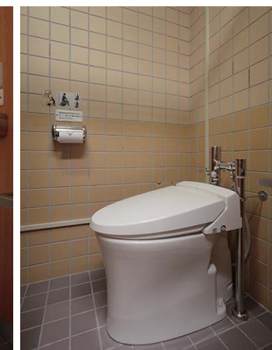
和式から洋式になり利便性が向上。