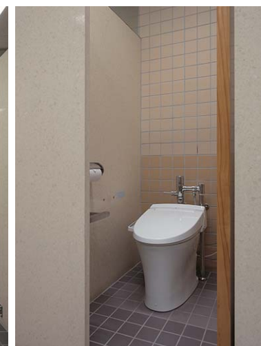
シャワートイレを完備し快適に。