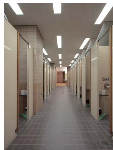
入り口と出口が分かれたプランニング。