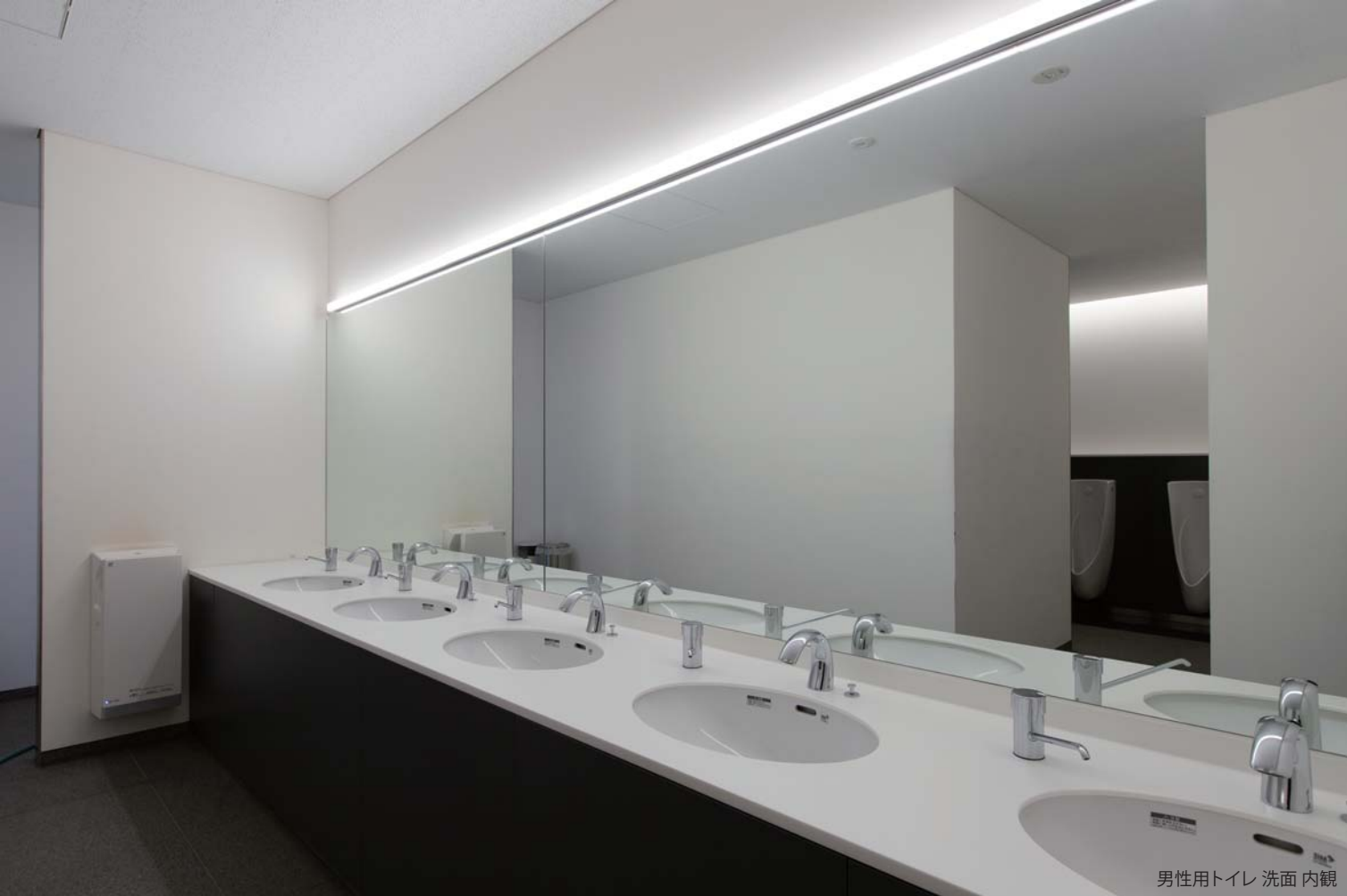
男性用トイレ 洗面 内観