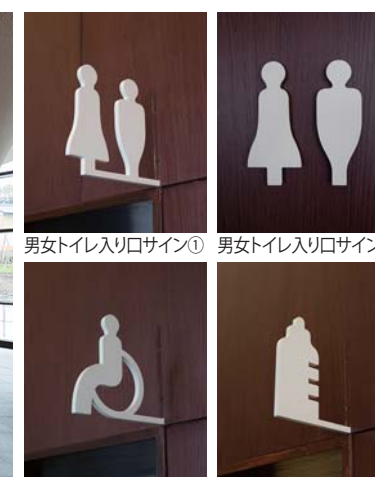
男女トイレ入り口サイン① 男女トイレ入り口サイン②