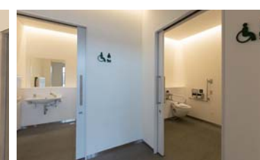
多機能トイレ入り口