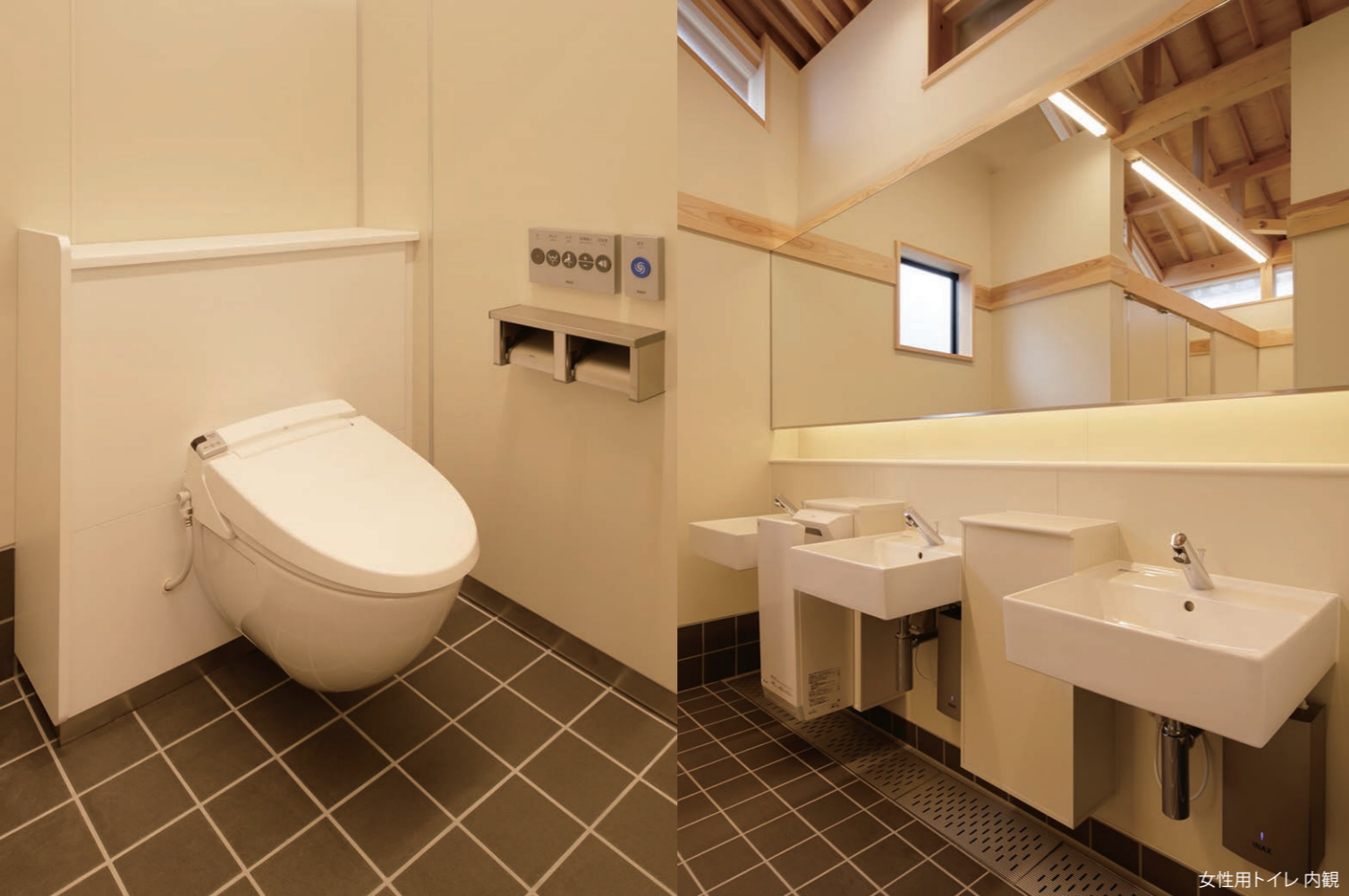
女性用トイレ 内観