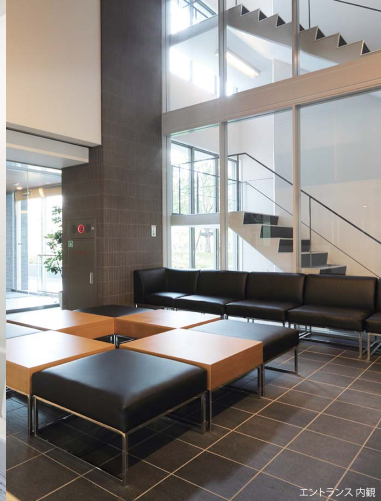
エントランス 内観