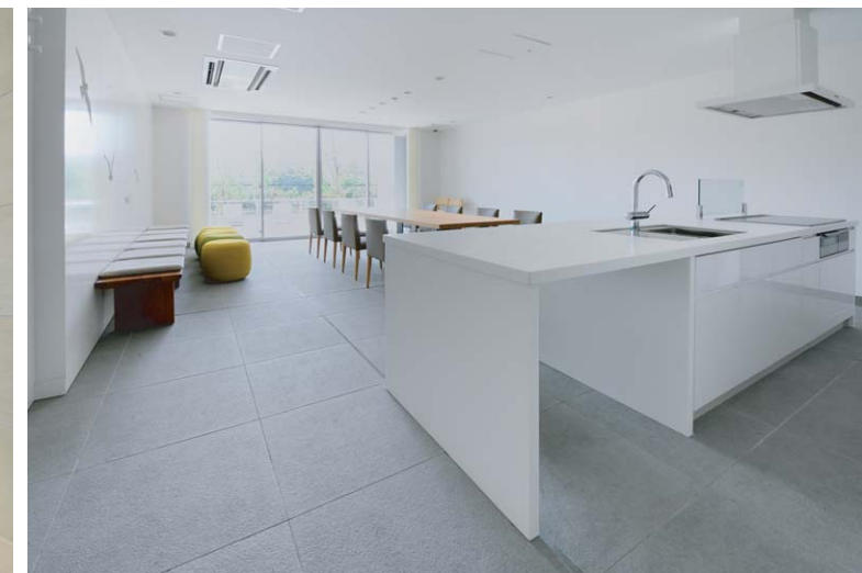
パーティールーム