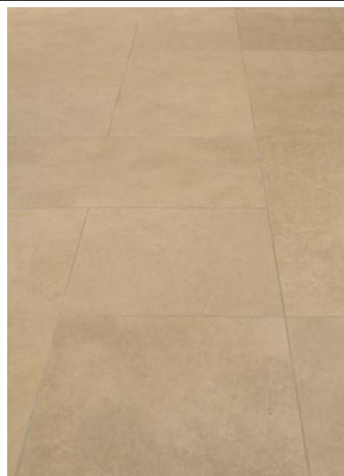
コリドール床タイルディテール