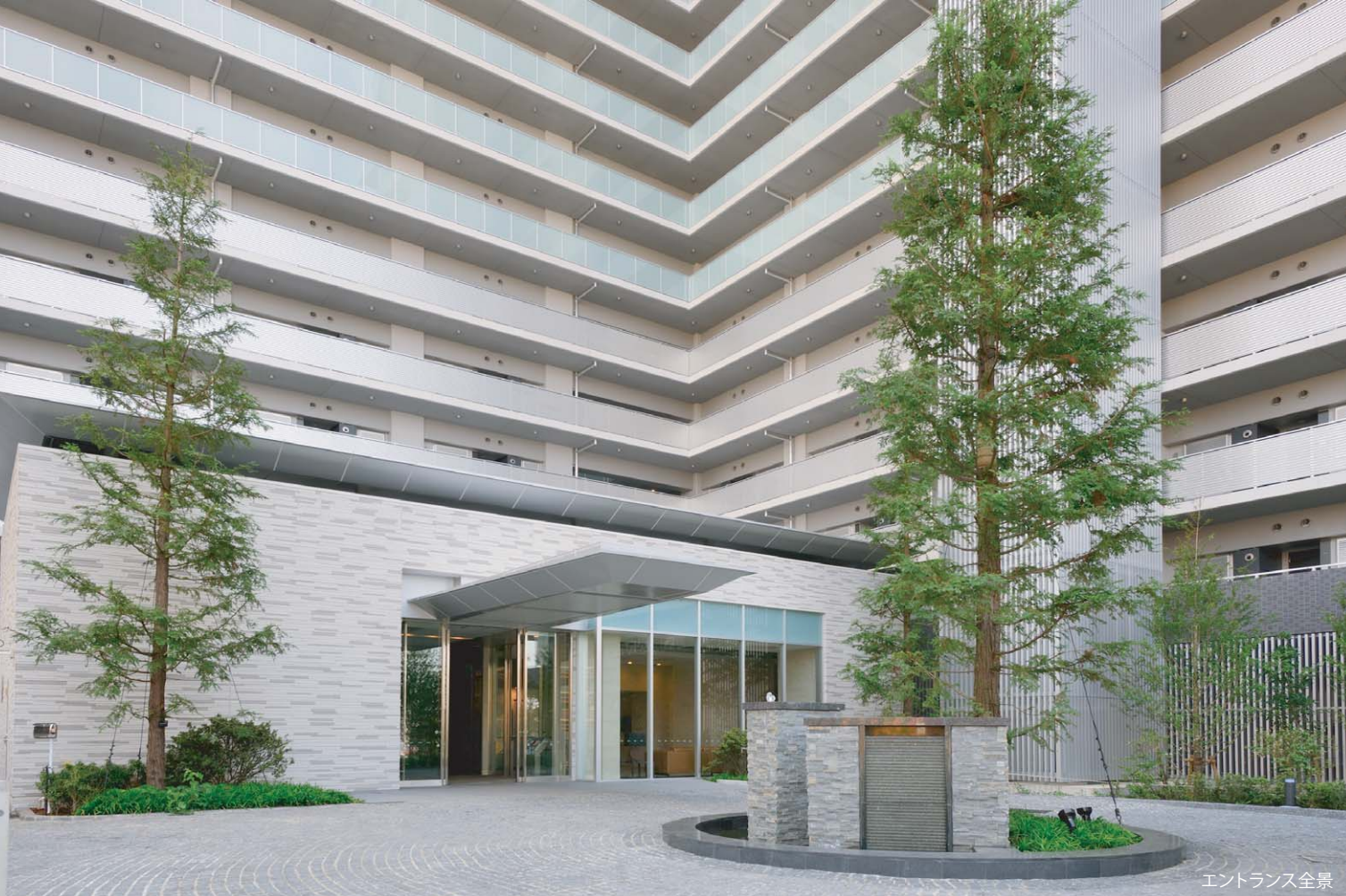
エントランス全景