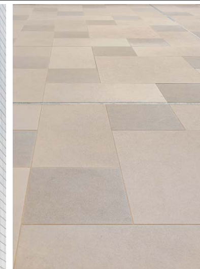
エントランスホール床タイルディテール