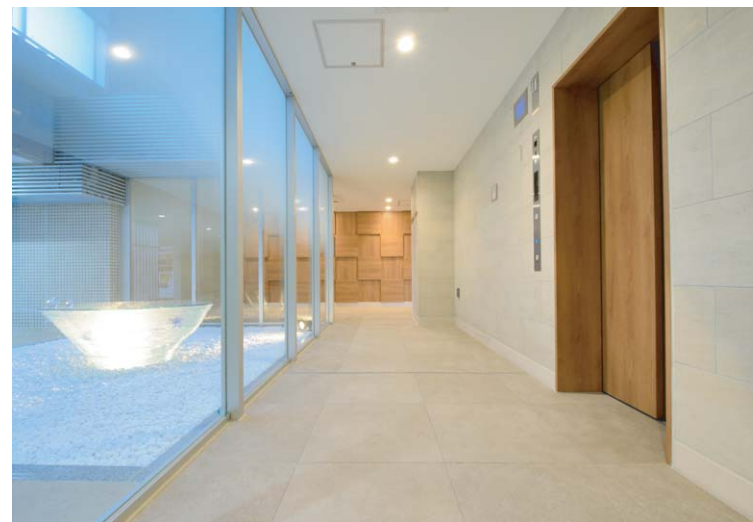
コリドール/エレベーターホール