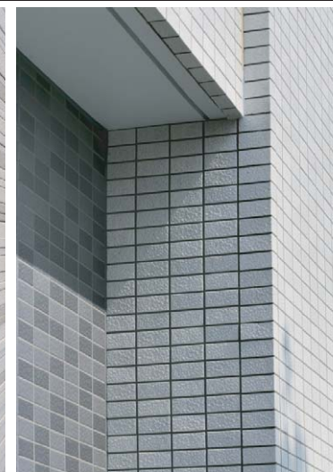
外装壁タイルディテール