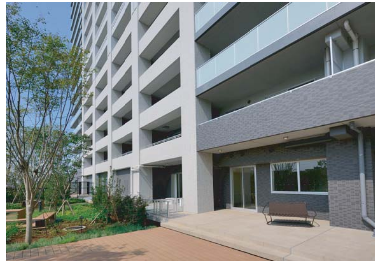
プライベートガーデン側外観