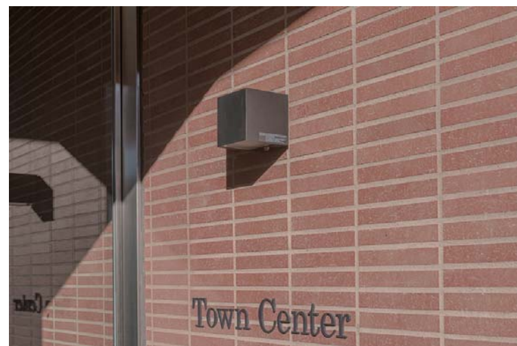
外装壁面タイルディテール