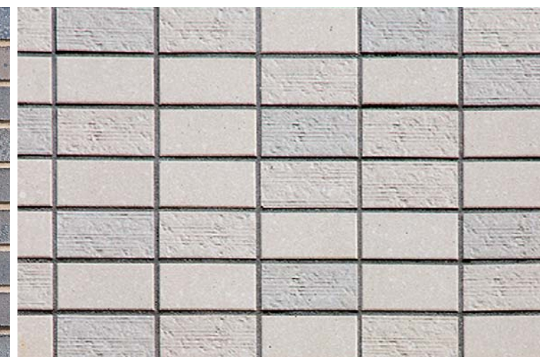
外装壁面タイルディテール