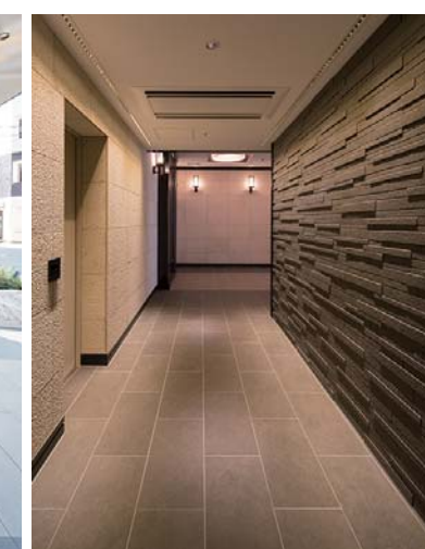
共有通路内装壁床面