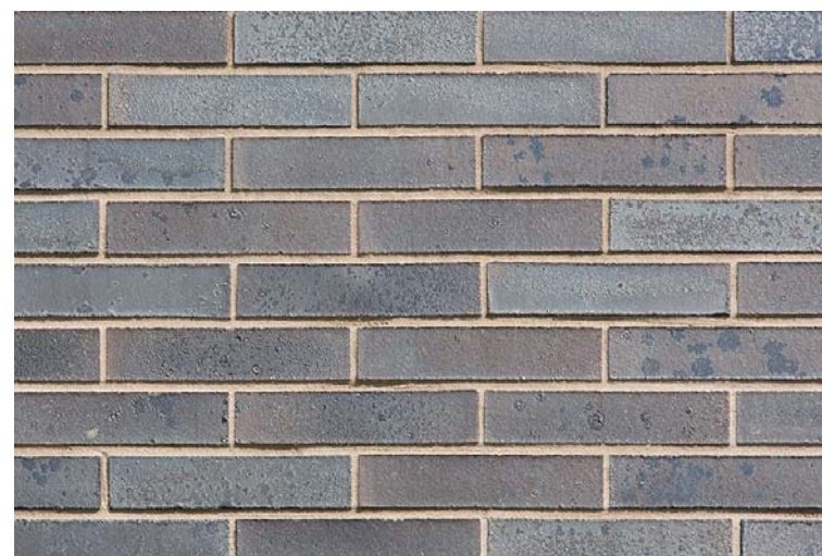
外装壁面タイルディテール