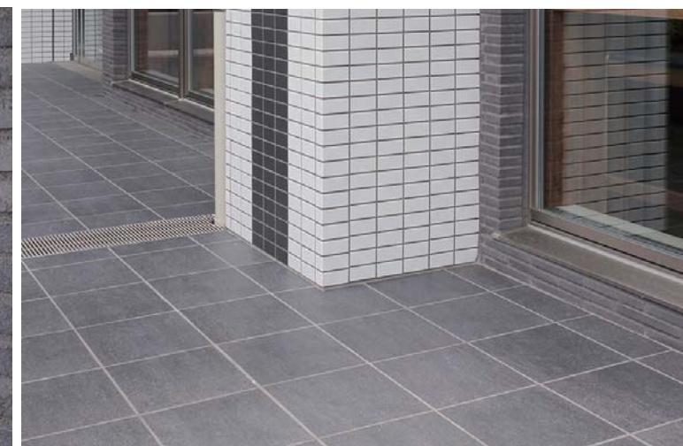
外装壁面床タイルディテール(テラス側柱まわり外壁)