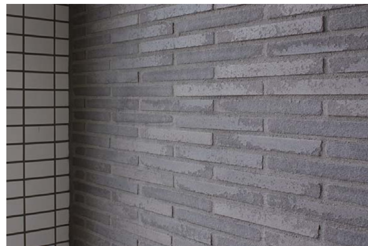
外装壁面タイルディテール(テラス側外壁)