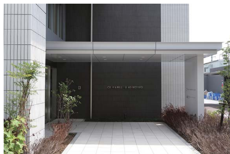
エントランス外観