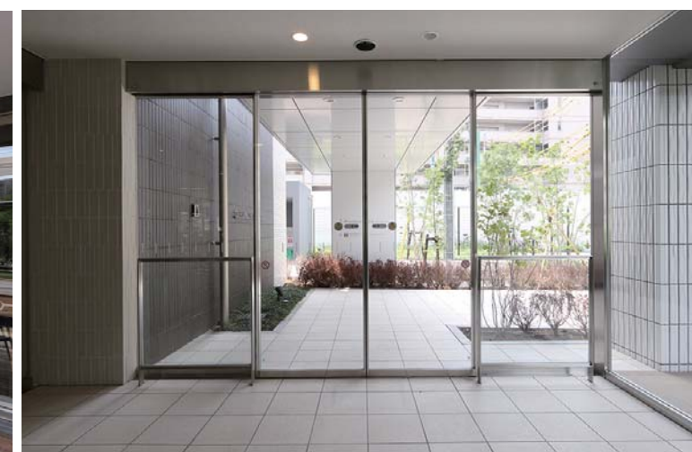
エントランス内観