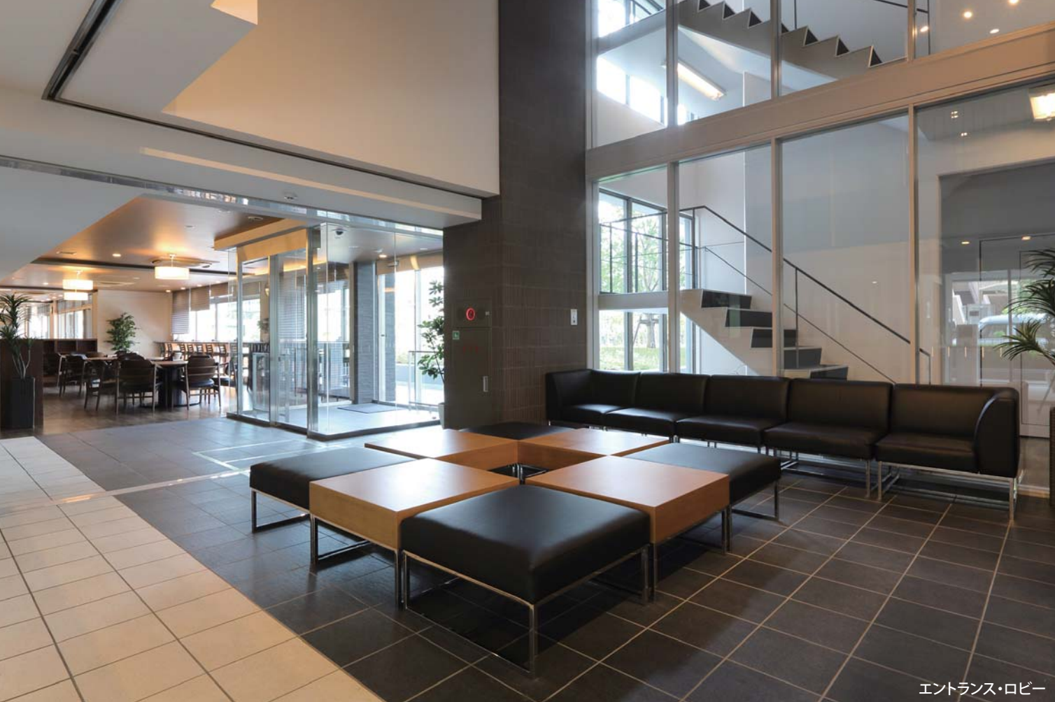
エントランス・ロビー