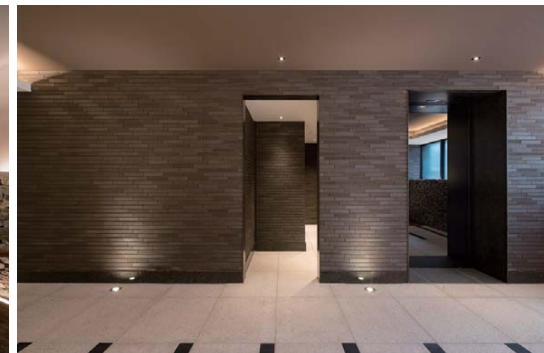
エントランスホール内観