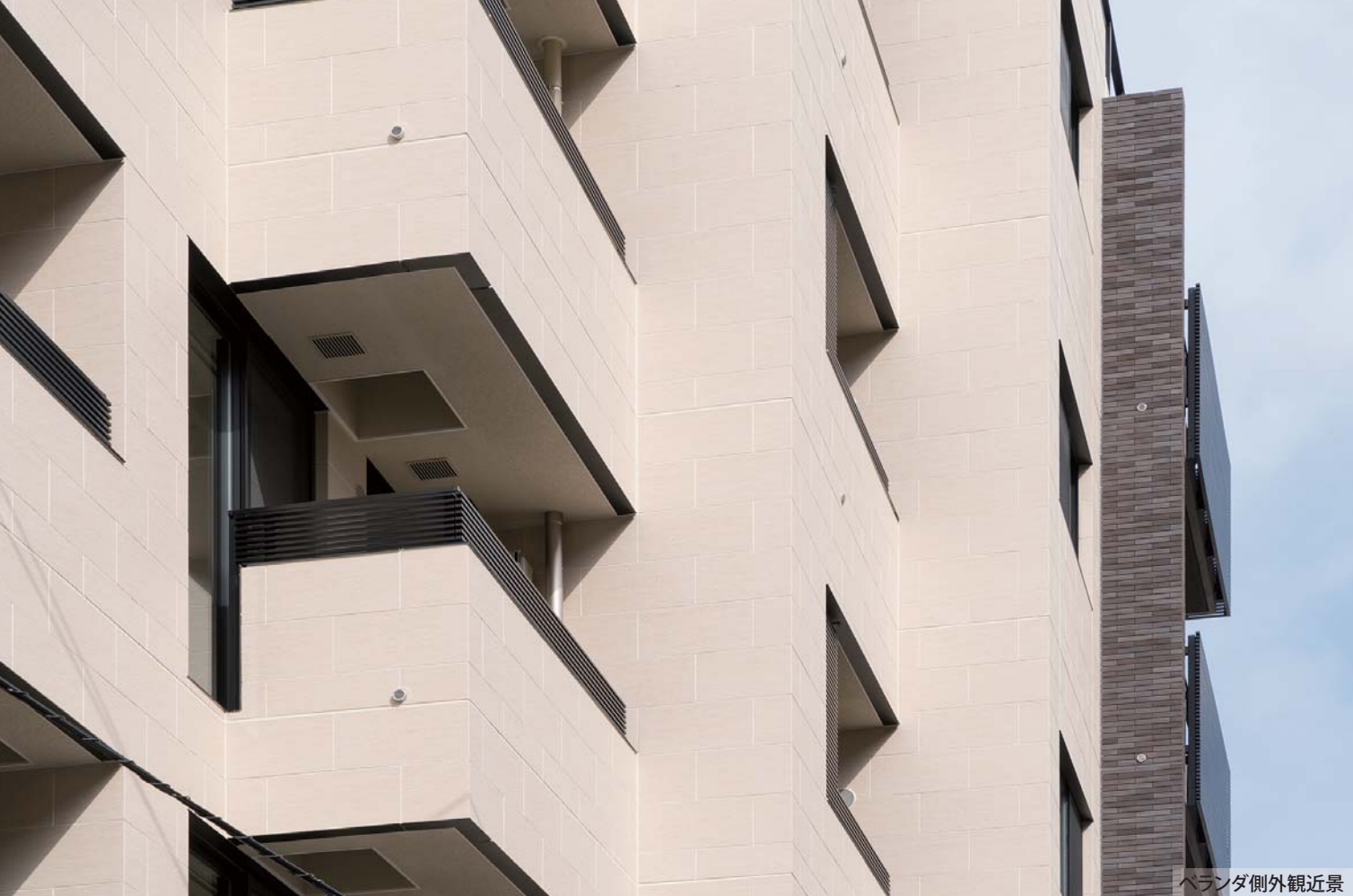
ベランダ側外観近景