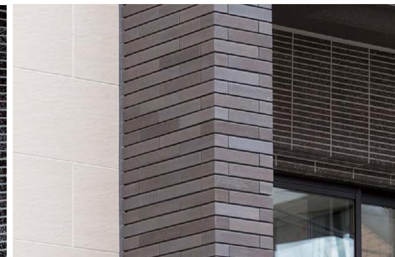
外装壁面タイルディテール