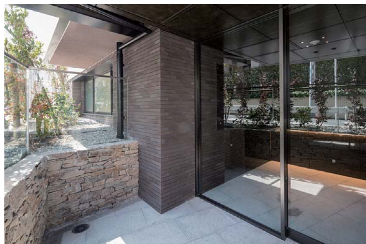
エントランス外観