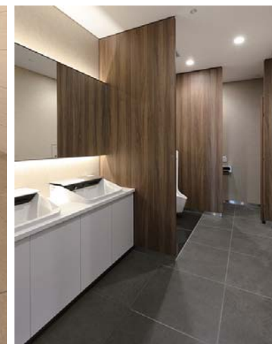
トイレ内装床面タイル