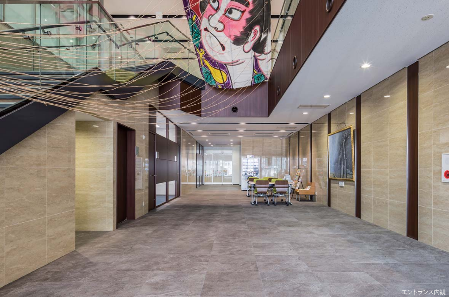
エントランス内観