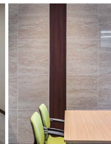
商談室内装壁面・床面