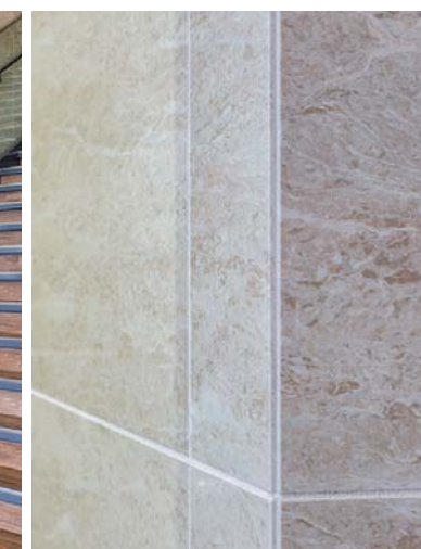
内装壁面タイルディテール