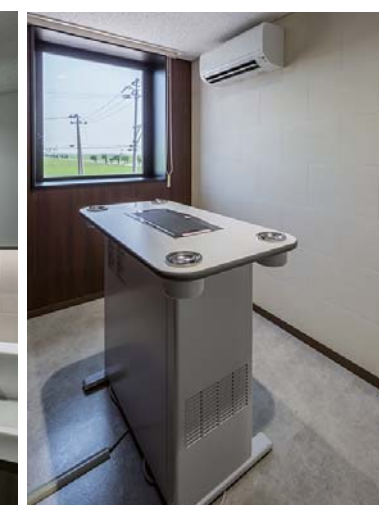
喫煙室内装壁面・床面