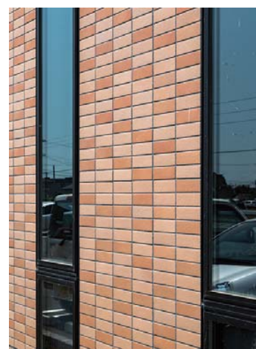
外装壁面開口部タイル