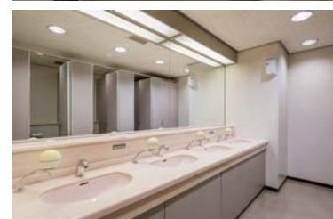
(上) 男性用洗面エリア (下) 女性用洗面エリア