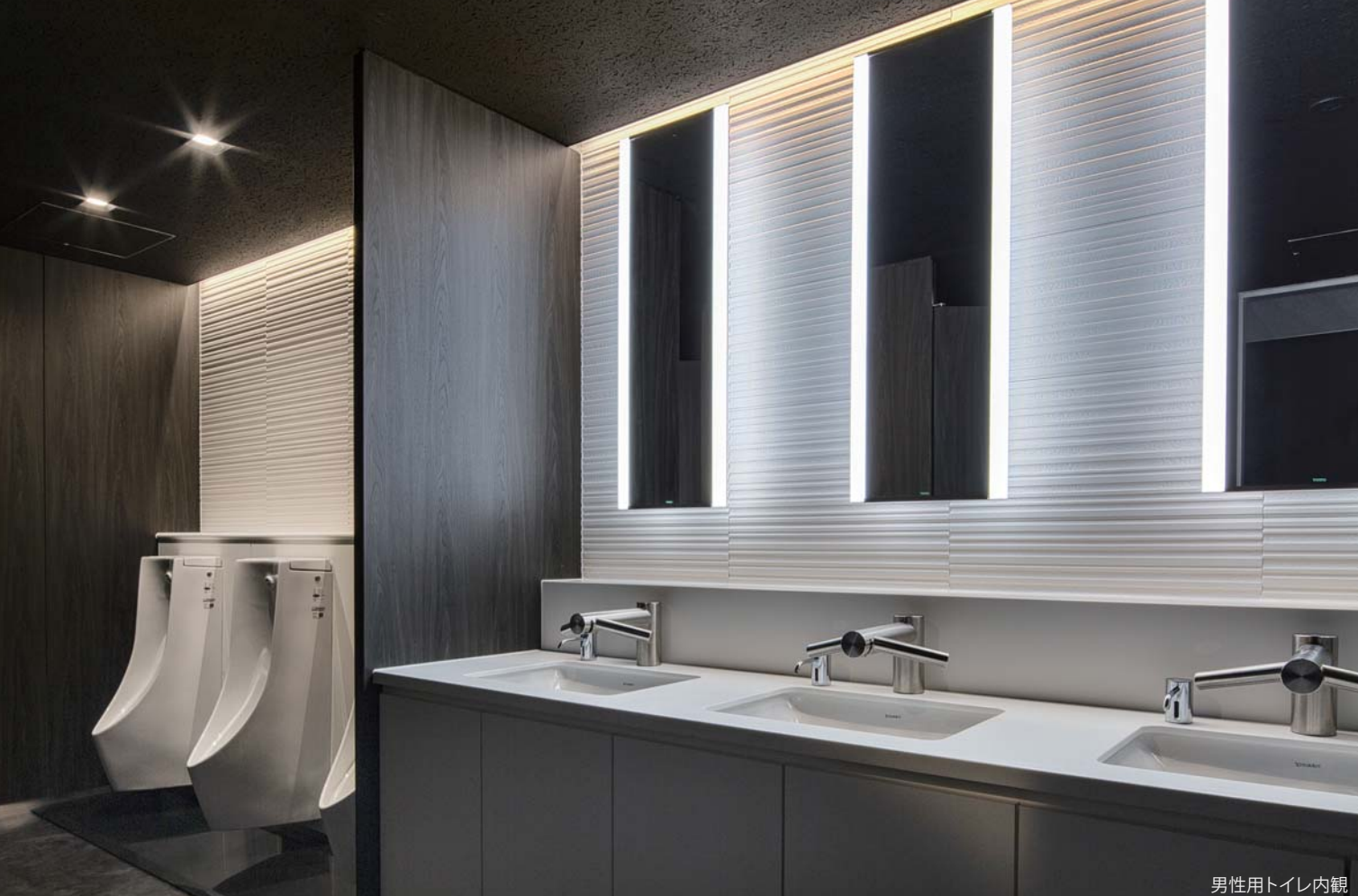
男性用トイレ内観