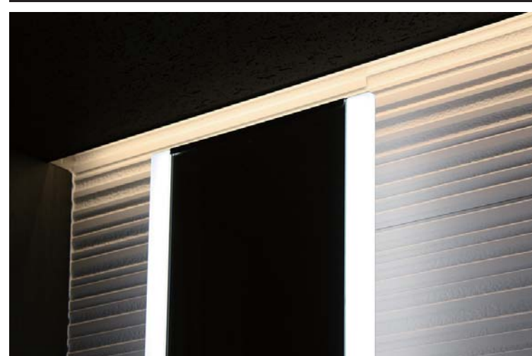
内装壁面タイルディテール