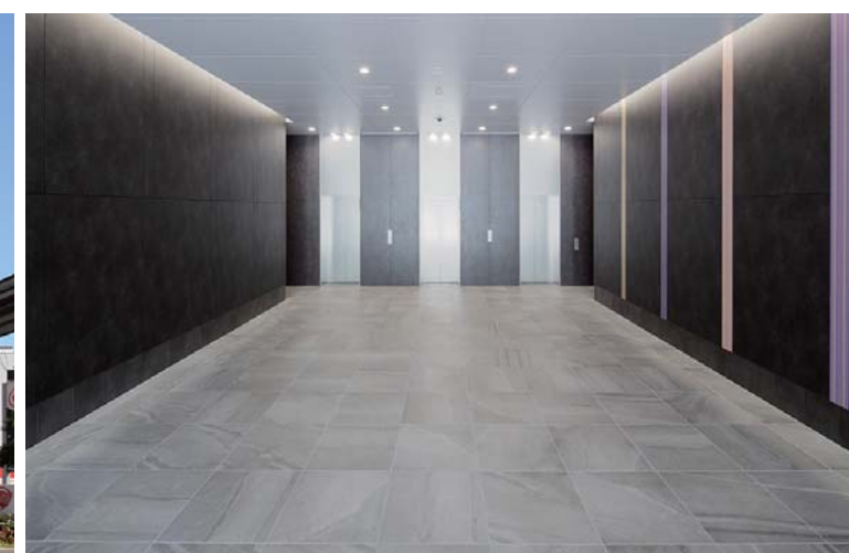
エントランスホール正面