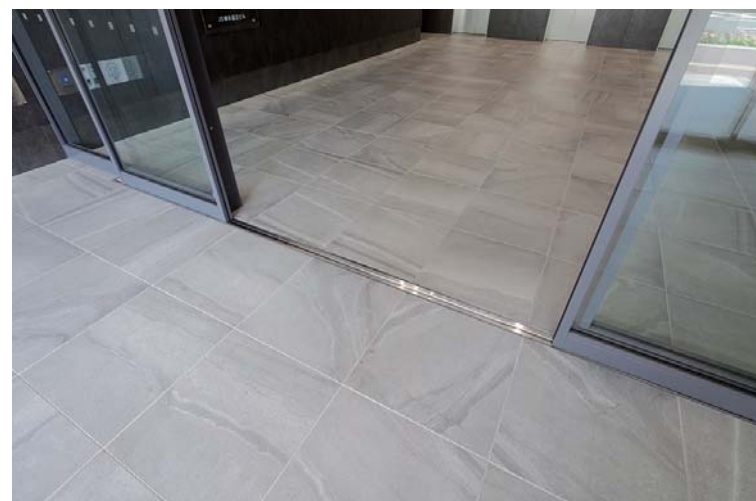
外装床面タイルディテール