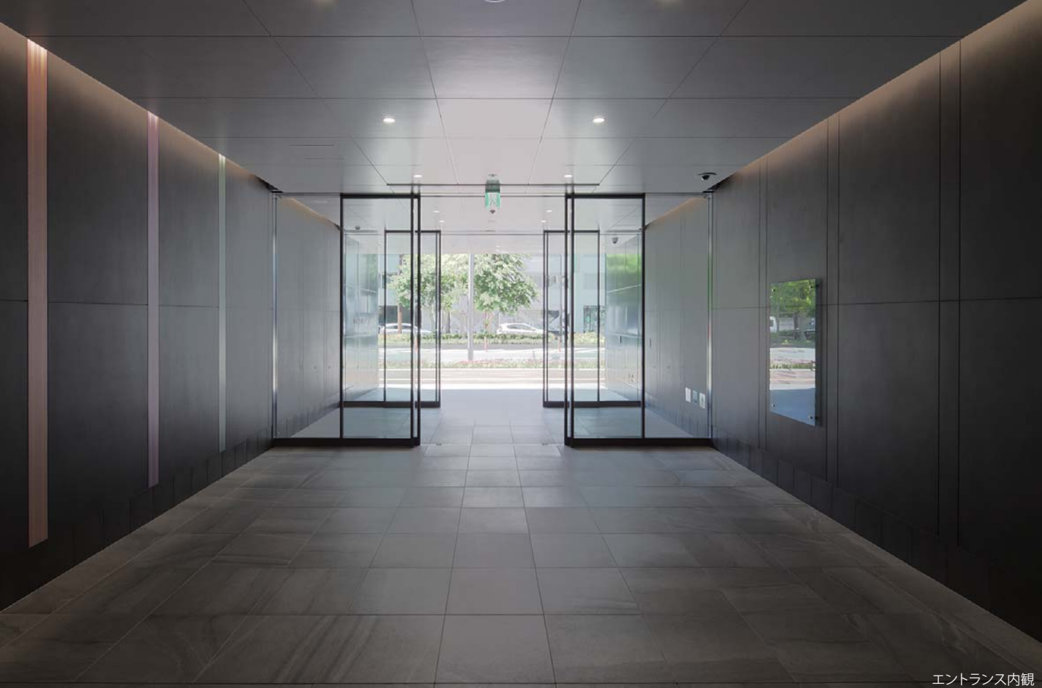
エントランス内観