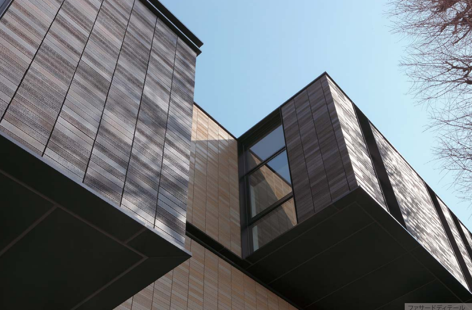
ファサードディテール