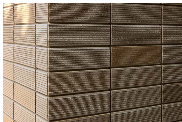
外装壁面タイルディテール