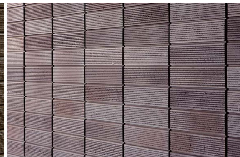
外装壁面タイルディテール