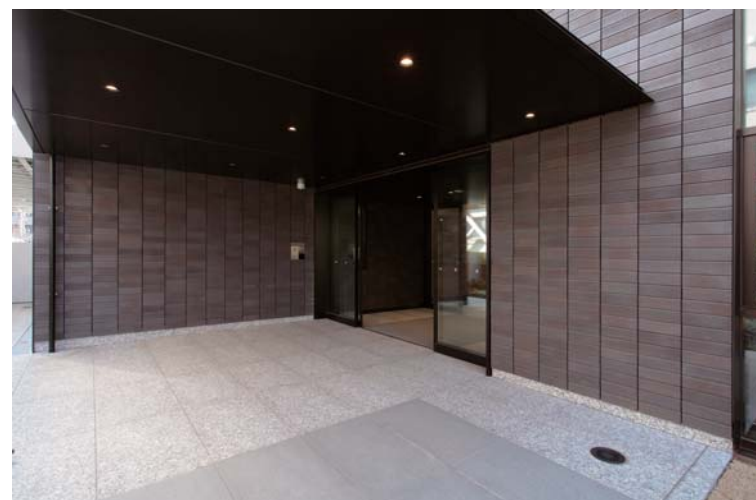
エントランス入口