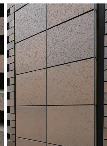
外装壁タイルディテール