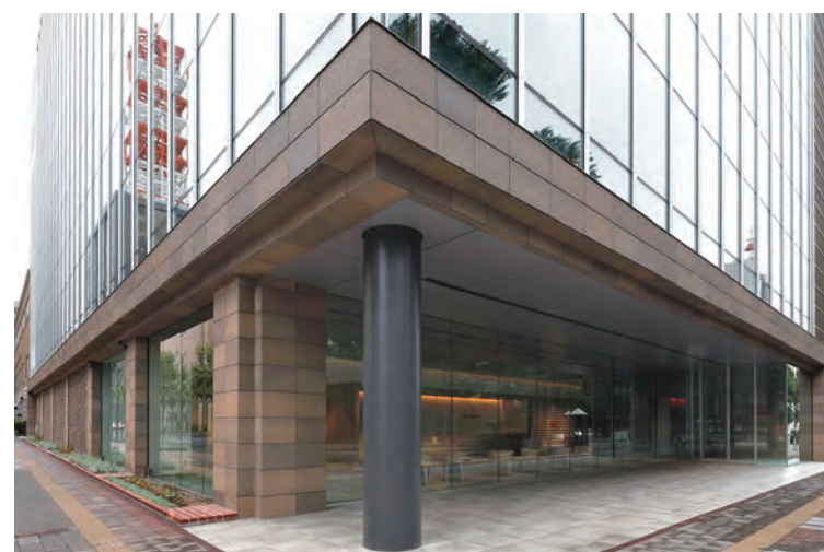
外装壁面(コーナー部)