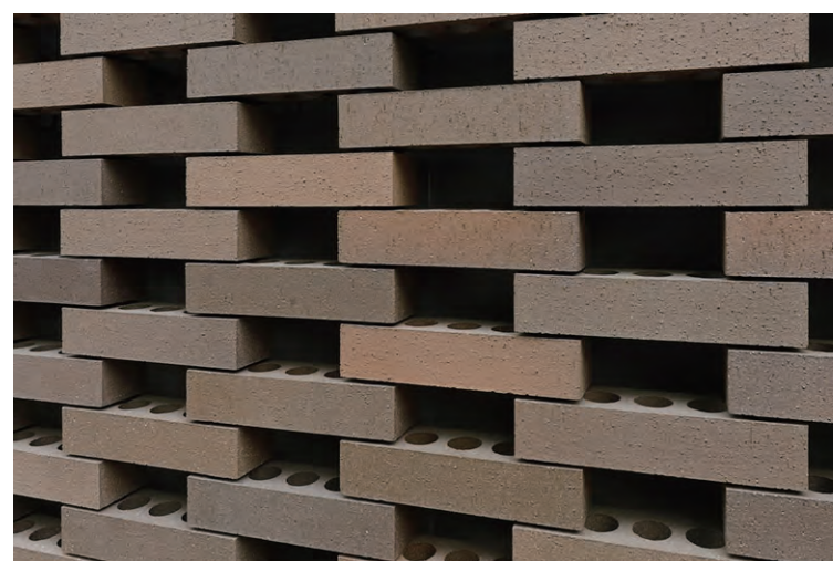
外装壁面透かし積みレンガディテール