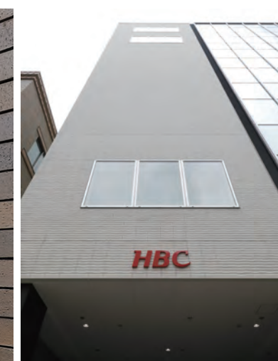
外装壁タイルディテール