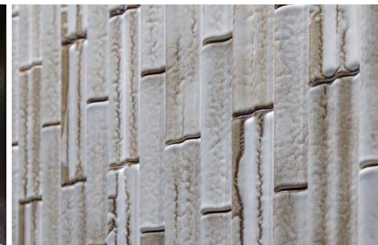
タイルテクスチャ