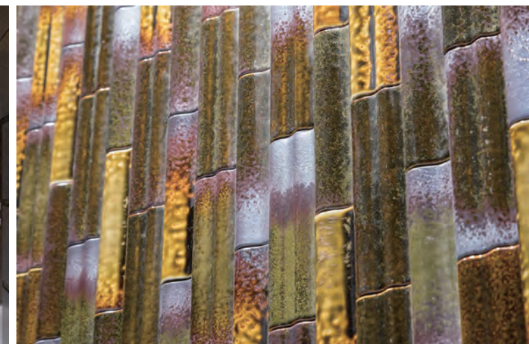
タイルテクスチャ