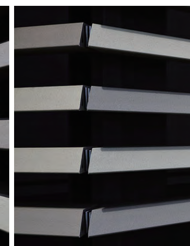
テラコッタルーバーディテール(コーナー部)