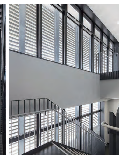
階段部分(内部より)