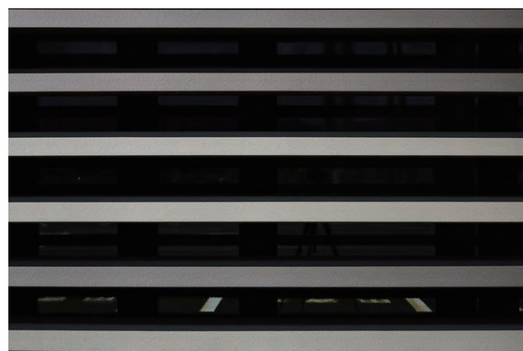
テラコッタルーバーディテール