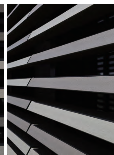
テラコッタルーバーディテール