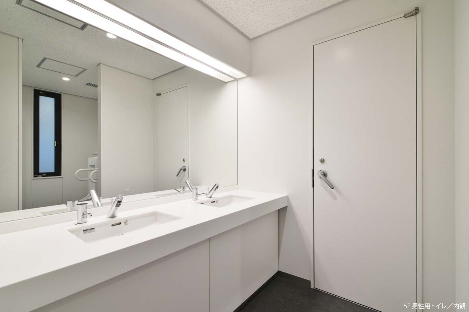
5F 男性用トイレ / 内観