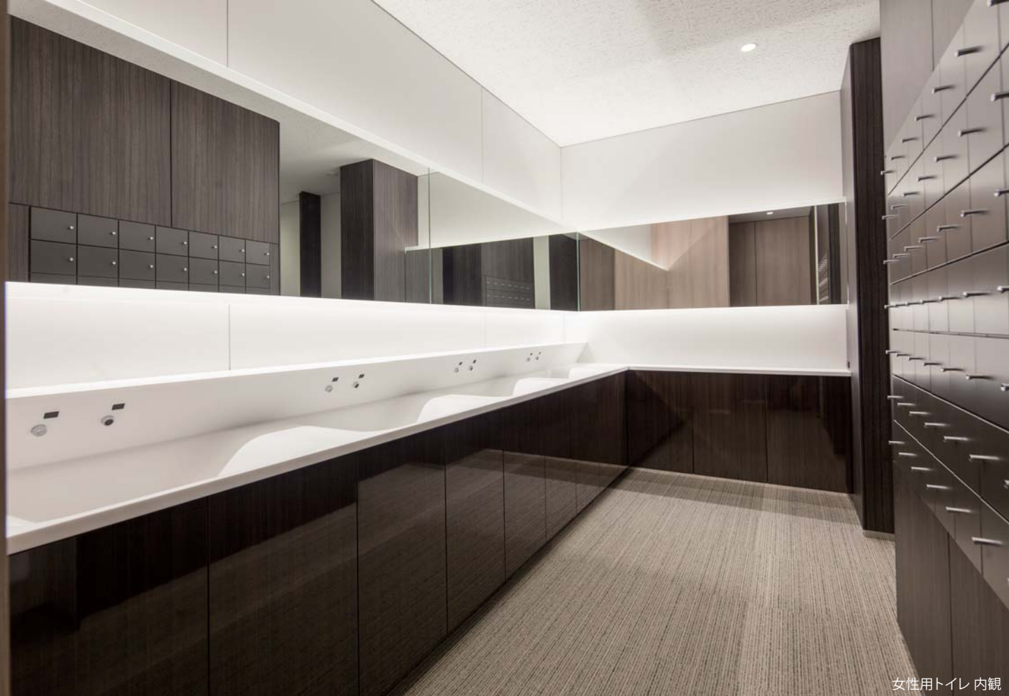
女性用トイレ 内観