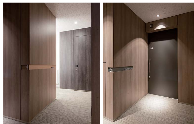
女性用トイレ入り口