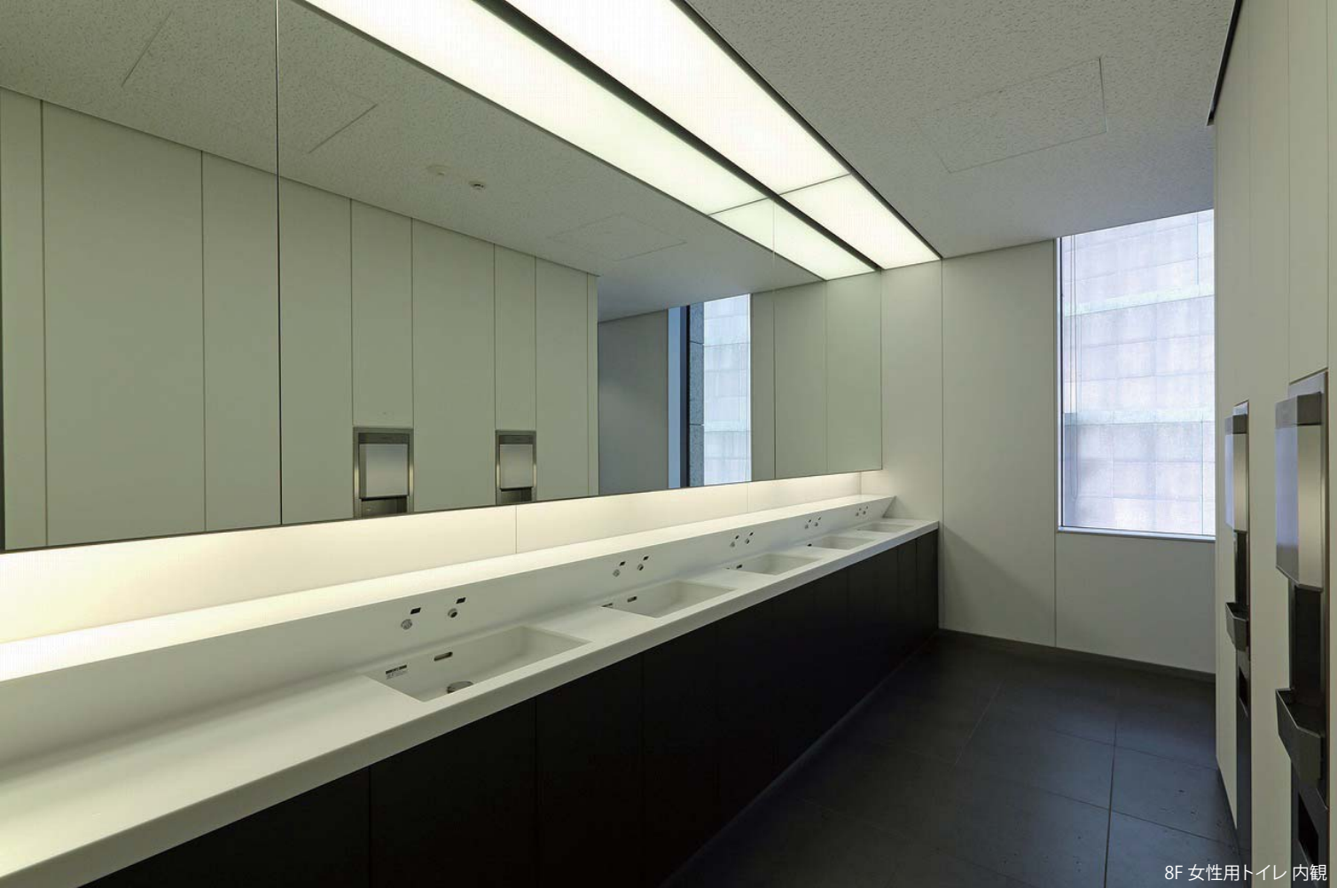
8F 女性用トイレ 内観