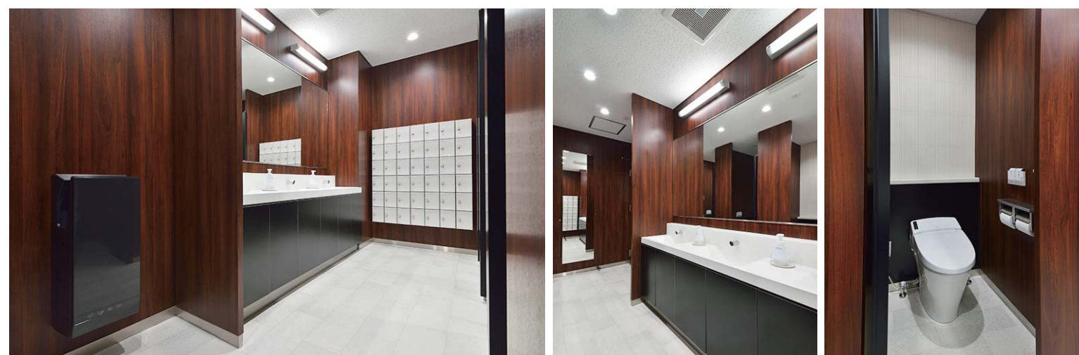
手荷物を濡らさず置けるスペースを備えた洗面カウンター。隣の人のジャマにならずに化粧ポーチなどを置くことができる。女性用の便座に座ると自動的に流水音が鳴り始め、音消し目的の無駄な洗浄を防止。高い節水技術も搭載し、経済性の向上が期待できる。ブースの間仕切りは天井まで伸ばし、プライバシー感を高めている。