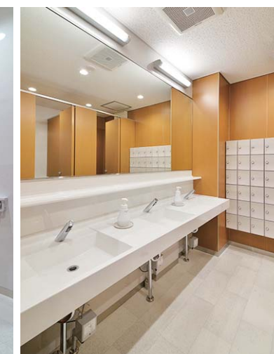
洗面エリアには歯磨きセットやサニタリー用品を収納できるミニロッカーを設置。