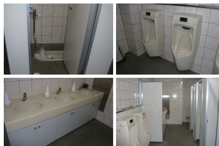
(上) 和風便器 (下) 洗面エリア