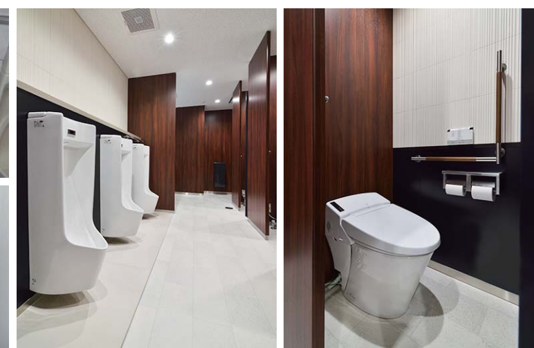
2Fは来賓の利用を考慮した高級感のある内装。小便器エリアや大便器ブース内に、空気をキレイにしクリーンな室内環境を提供するタイルのエコカラットを採用。