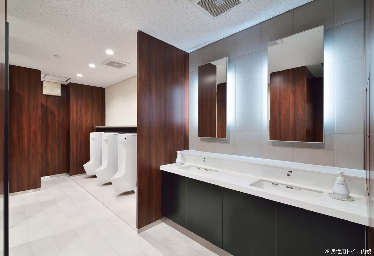
2F 男性用トイレ 内観