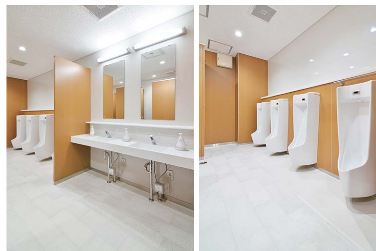
1Fは2Fとトーンの違う、白を基調とした明るく清潔感のある空間。コンパクトなポウル一体型で空間を広々と見せる洗面カウンターを採用。非接触で衛生的な自動水栓で利用者の清潔性と快適性に配慮。