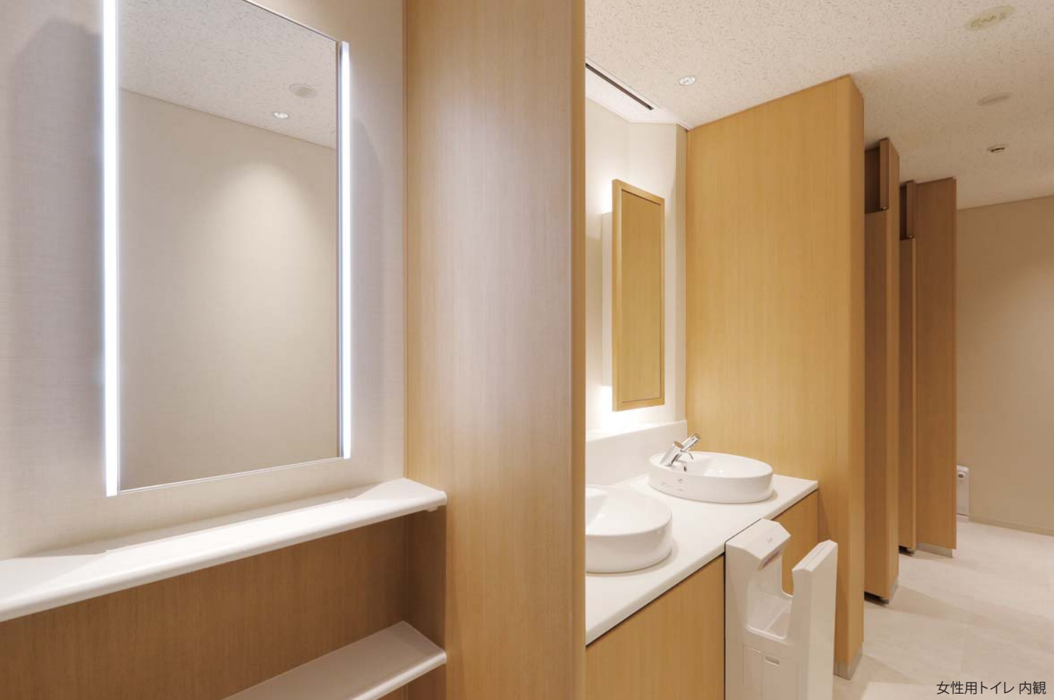
女性用トイレ 内観