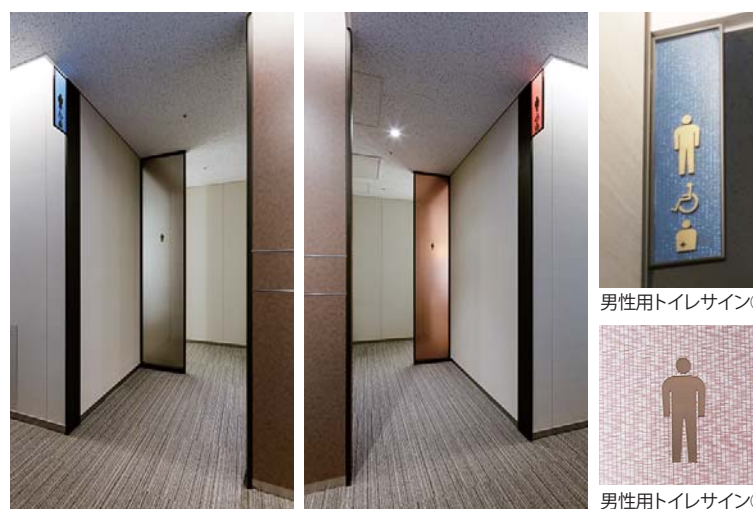
男性用トイレサイン①