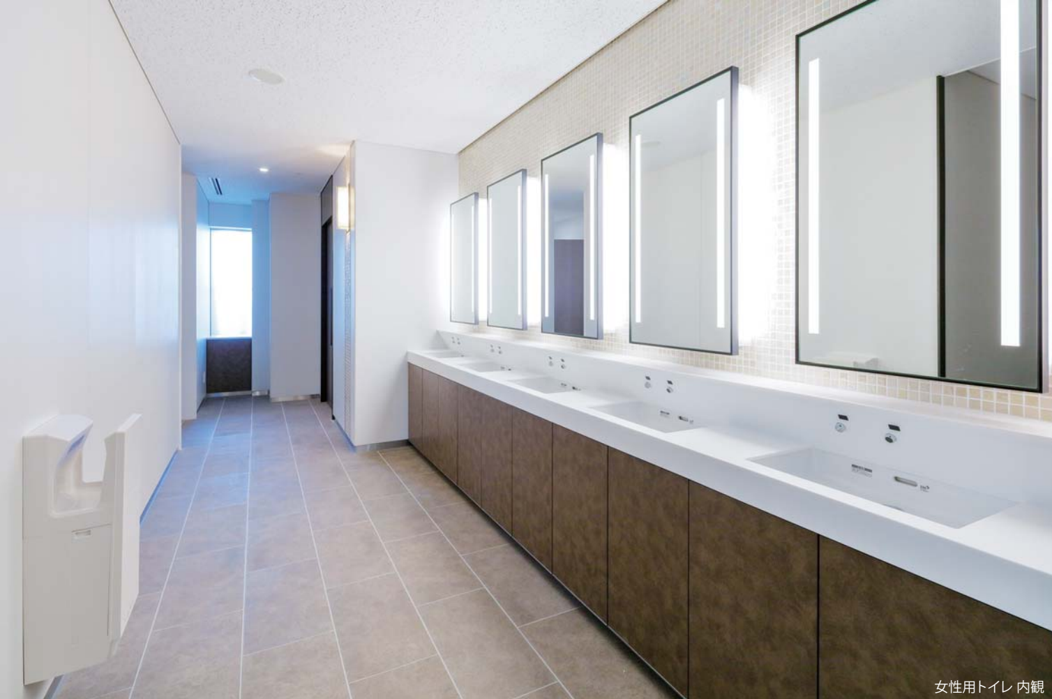
女性用トイレ 内観