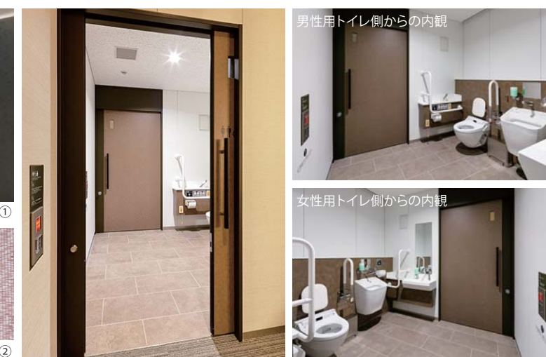
男性用トイレ側からの内観