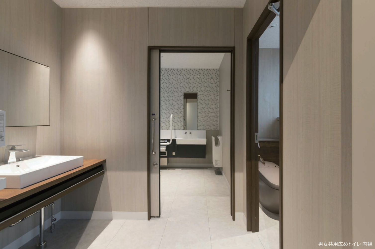
男女共用広めトイレ 内観